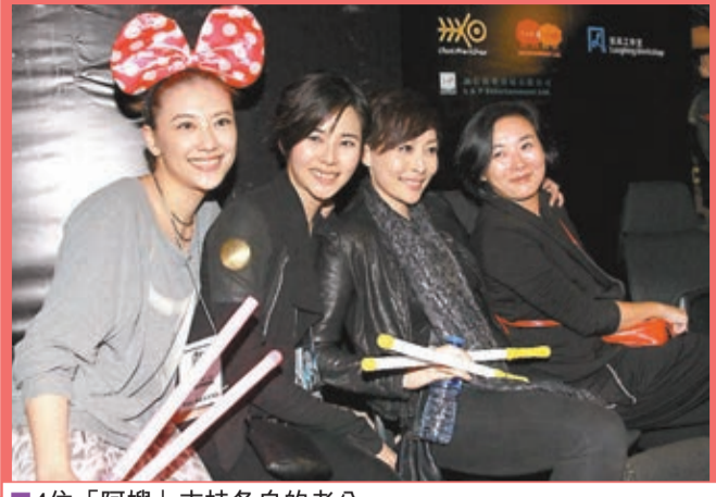
4位「阿嫂」支持各自的老公。