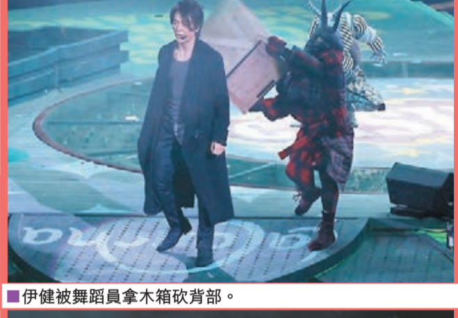
伊健被舞蹈員拿木箱砍背部。