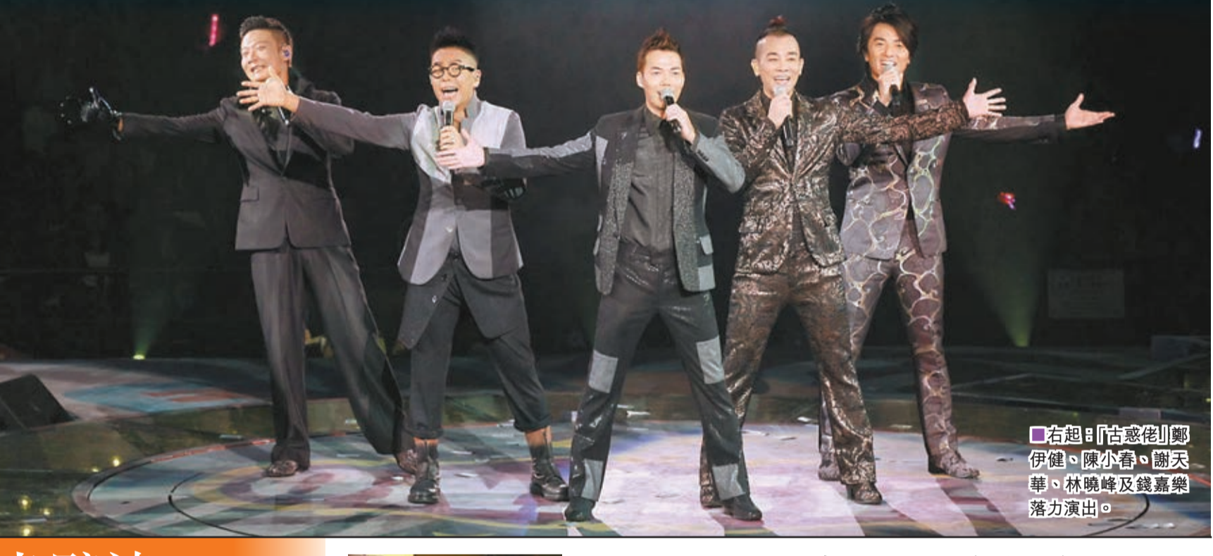
右起「古惑佬」鄭伊健、陳小春、謝天華、林曉峰及錢嘉樂落力演出。