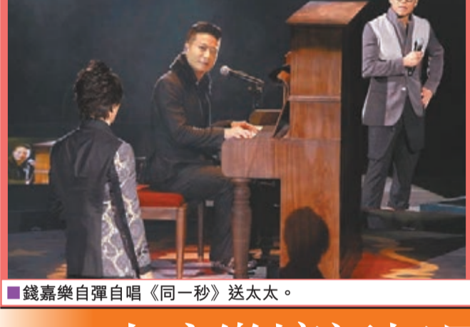
錢嘉樂自彈自唱《同一秒》送太太。