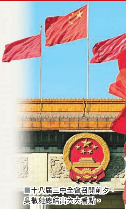
■十八屆三中全會召開前夕，吳敬璉總結出六大看點。

■吳敬璉：我在上世紀90年代說過一句話：沒有競爭的市場比沒有市場還可怕。這就是行政保護、地區保護、壟斷等等，使得這個市場缺乏競爭性。市場缺乏競爭性就不能夠形成有效配置資源的價格，不能形成這樣的價格就不能夠有效的解決。所以一定要強調要有競爭性。