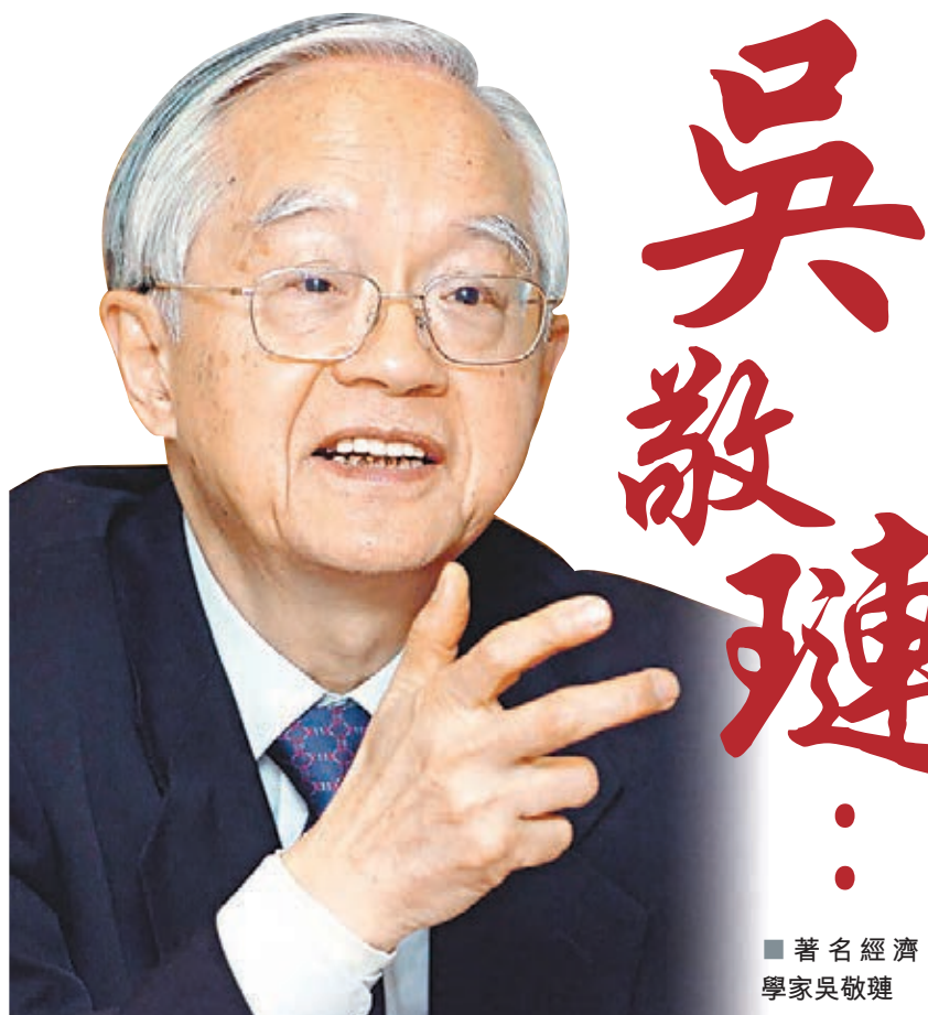
■著名經濟學家吳敬璉