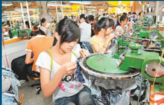
■吳敬璉表示，政府和國有企業仍然在資源配置中起着支配作用，民營經濟生存空間較小。圖為內地一民營企業的生產車間。