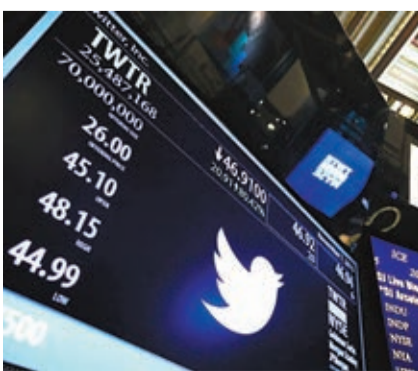
■twitter以26美元掛牌，首日最高曾升至48.15美元。