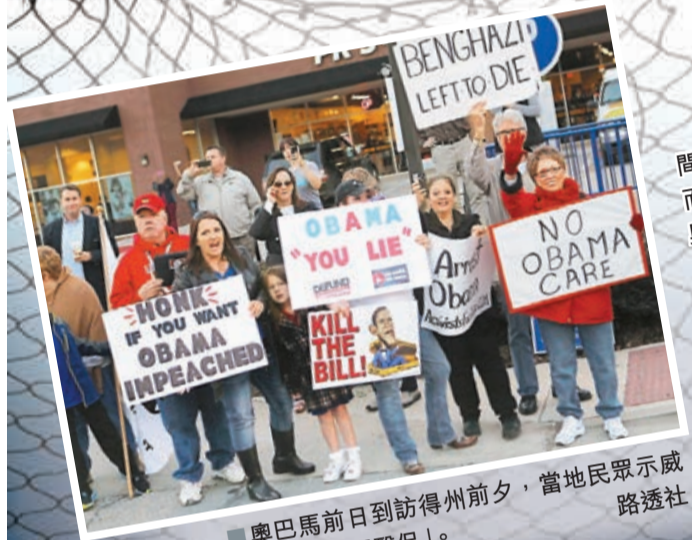
■奧巴馬前日到訪德州前夕，當地民眾示威抗議「奧巴馬醫保」。

美國總統奧巴馬早前推銷「奧巴馬醫保」期間，反覆向民眾承諾原有保單不會被取消，然而不少民眾近期仍收到舊保單被取消的通知。奧巴馬前日首度致歉，承諾會幫助失去保單的人解決困境，並指正研究改善啟動一個多月以來經常故障癱瘓的平價醫保網上交易平臺。