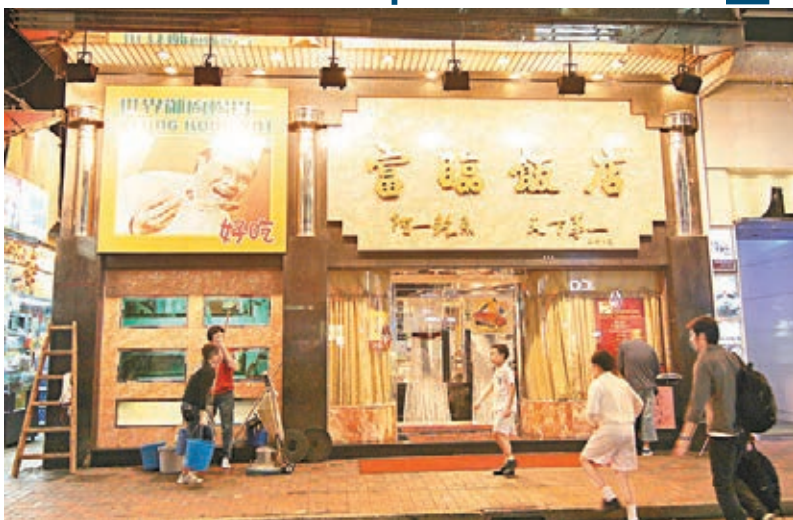
圖為香港銅鑼灣富臨飯店。

返到九龍區,食肆生存戰依然打得激烈,當中尖沙咀和旺角當然是災區之一。曾以旺角廣華街總店的