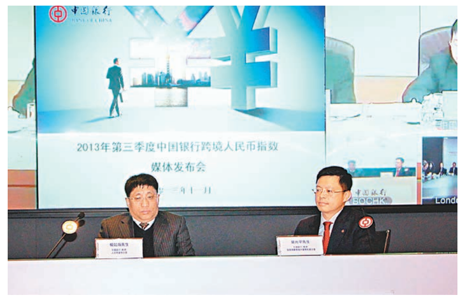
北京、香港及倫敦三地發佈「2013第三季度中國銀行跨境人民幣指數」。

香港文匯報訊(記者陳楚倩、葛沖)中國銀行(3988)昨日同時在北京、香港、倫敦三地發佈第三季度跨境人民幣指數。據其公佈，第三季度跨境人民幣指數為190點，較去年同期上升46點或31.94%；較上季度上升4點，升幅2.15%；今年前三季，指數累積升幅達到30%，反映人民幣在跨境貿易中的使用水平繼續提高。