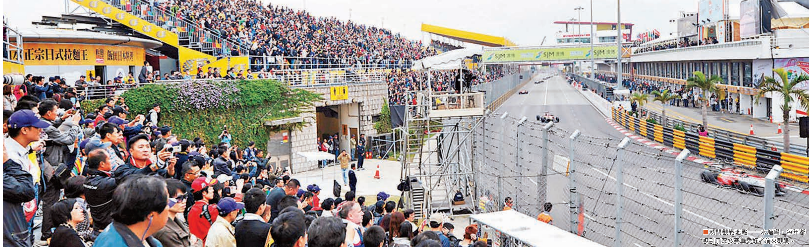
熱門觀戰地點——水塘灣，每年都吸引了眾多賽車愛好者前來觀戰。

為了讓第60屆澳門大賽車更有嘉年華氣氛，本屆支援賽事亦增添了一些新的賽事，有奧迪R LMS盃、亞洲保時捷卡雷拉盃、林寶堅尼Super Trofeo 亞洲挑戰賽及青年冠軍方程式系列賽，其中青年冠軍方程式系列賽是一個全新的方程式系列賽，旨在培養中國和亞洲的年輕賽車手。另一值得大家期待的賽事——高龍R中國大師挑戰賽，來自世界各地的房車賽手、方程式車手和電單車手將在賽事中一較高下。 此外，為讓市民同慶和參與，賽場內外加插了多項活動。大賽車期間，將繼續在塔石廣場舉行路車、超級跑車展，以及在友誼廣場舉行格蘭披治電單車展。此外，今年還將會有來古典汽車和電單車在賽道上作巡遊。 除了支援賽事及車展外，怎麼少得了精彩的煙花表演呢！大賽車期間，11月10日、13日以及17日晚9時，將有璀璨奪目的煙花表演共同為大賽車助興，精彩不容錯過。