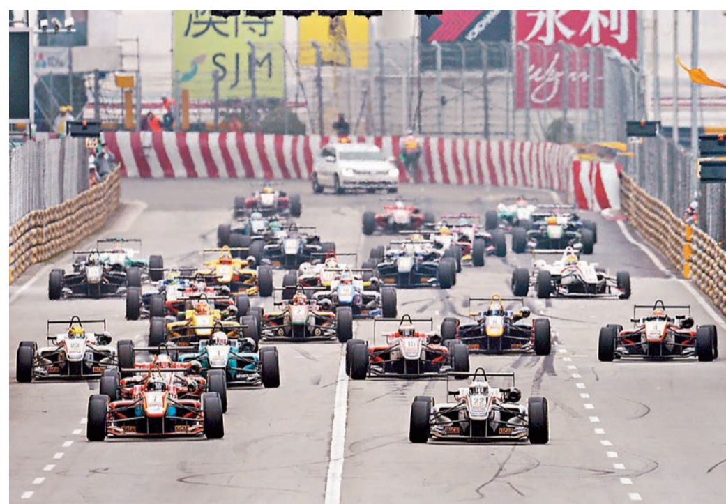
眾多頂尖車手將齊聚澳門，挑戰今屆的三級方程式大賽。