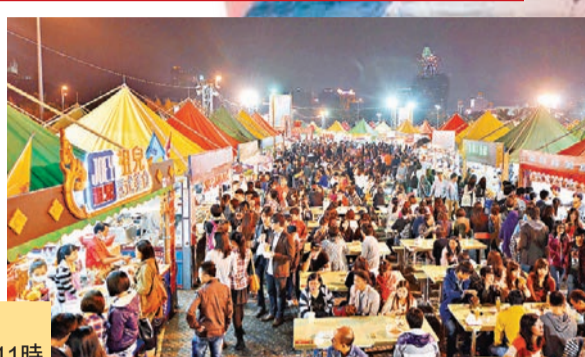
每年的美食節都吸引了眾多的市民及遊客參與。

第13屆澳門美食節要開鑼了，本屆美食節網羅了逾百的本地特色飲食商號，更首度邀請到超過30家的泰國特色飲食商號越洋參與，為市民及遊客帶來更多元、嶄新的佳餚美點。 美食節一如既往設置了「中式美食街」、「歐陸美食街」、「亞洲美食街」、「風味美食街」及「甜品街」。此外，還新加入別具泰國風貌的「泰國村」，匯聚了泰北、泰東北、泰中及泰南、泰國四大菜系的魅力小食。讓市民及遊客飽覽澳門中西飲食文化共融的烹調精髓之餘，亦能感受地道的泰國風情。大會亦在西灣湖兩層設有多個攤位遊戲，以供娛樂，以及每晚安排一連串精彩的節目表演助興。 今屆美食節還達「澳門格蘭披治大賽車」60周年鑽禧，故特別採用大賽車為設計概念，並以「美食賽車巡禮」為口號，營造一個與眾不同、動感繽紛的美食嘉年華活動。