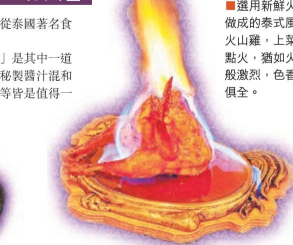
選用新鮮生蝦做成的泰式風味火山雞，上菜時點火，猶如火山般激烈，色香味俱全。

坐落於澳門漁人碼頭的廚泰餐廳，是一家泰式料理店，總廚及其團隊是老闆專程從泰國著名食府邀請過來的，餐廳每日供應新鮮食材，配料及獨特的醬料更是從泰國空運到澳。 廚泰供應菜式繁多，由常見的泰國菜式以至少見的泰國風味小食都有。「脆生蝦」是其中一道不可不試的菜式，選用新鮮生蝦，配以十多種材料調製的泰式醬汁，生蝦的鮮甜與秘製醬汁混和於口中，鮮與辣的感覺，很是過癮。此外，火山雞、紅酒豬手、冬菇湯粉、炸蝦卷等皆是值得一試的招牌菜。 餐廳設有露天茶座，讓你可以一邊品嚐美味佳餚，一邊觀賞海景。