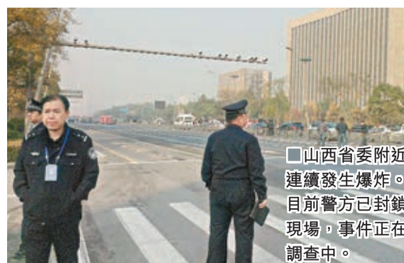
山西省委附近連續發生爆炸。目前警方已封鎖現場，事件正在調查中。

另外，據太原新聞網報導，從太原長途汽車站獲悉，11月7日起，乘坐長途車前往北京的市民，必須持本人有效身份證件才能購買車票。為保證出站客車的安全，太原汽車站不僅對旅客隨身攜帶的行李包進行安檢，同時對托運行李還要開包檢查，合格後才能托