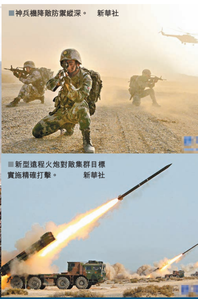
神兵機降敵防禦縱深。