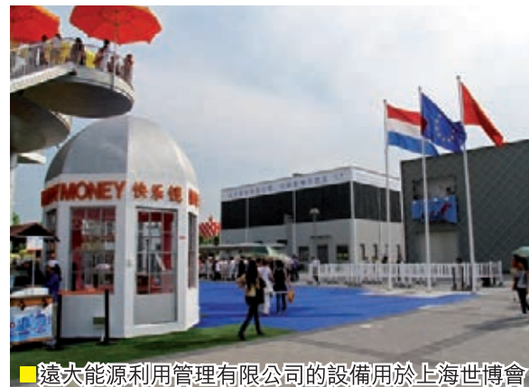
■ 遠大能源利用管理有限公司的設備用於上海世博會

習近平總書記日前在率領中央政治局視察中關村時曾指出，「要着力擴大科技開放合作。要深化國際交流合作，充分利用全球創新資源，在更高起點上推進