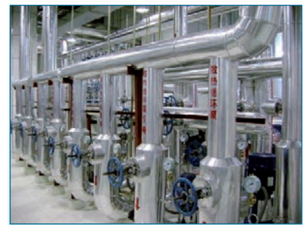
■ 北京合創三眾能源科技股份有限公司空調系統主機房——循環泵組

遠大能源和三眾能源在國際市場取得的成績，只是眾多中關村企業在國際競爭中大顯身手的一個縮影。中關村國家環境服務業發展聯盟秘書長徐雲介紹說，「中關村節能環保企業已經超過2,000家，產值年均增長超過20%，其中年收入達到1億元以上的達到194家，儲備了一批擁有自主知識產權與領先技術的龍頭企業。」