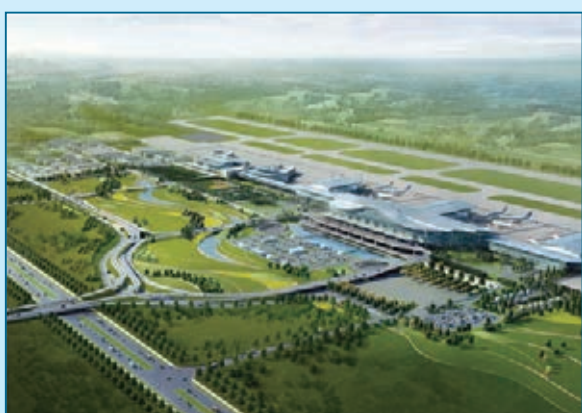
■ 遠大能源利用管理有限公司的設備用於黃花機場

專門成立了「國際化領導小組」。這個小組堪稱是一個由頂尖人才構成的豪華團隊，骨幹成員裡有人擔任過科技部駐以色列參贊，還有人曾是世界銀行專家，現為政府特聘專家。