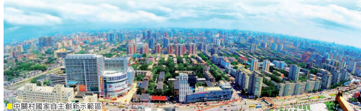
■ 中關村國家自主創新示範區

此次獲得IASP2015年年會的舉辦權，正是落實總書記「着力擴大科技開放合作」的重要舉措。這不僅將有利於示範區更好地融入全球創新區域網絡，借鑒國際科技園區先進的發展和管理理念，以全球視野謀劃和推動創新，優化創新創業生態系統；還將有利於示範區利用全球創新資源開展國際科技合作，集聚國際高端創新資源，發揮示範引領作用，推動國內各高新區參與國際合作，提高中國創新區域的國際化發展整體水平，加快建設具有全球影響力的科技創新中心的步伐。