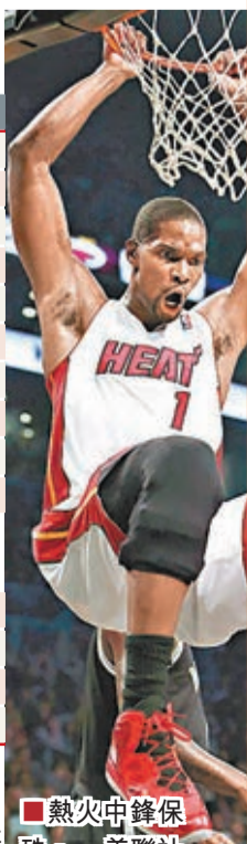
熱火中鋒保殊。

●now635台10:30a.m.直播 ●now678台9:00a.m.直播 註：直播時間以電視台公布為準