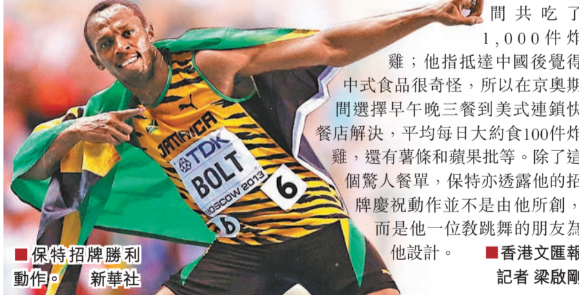
保特招牌勝利動作。新華社