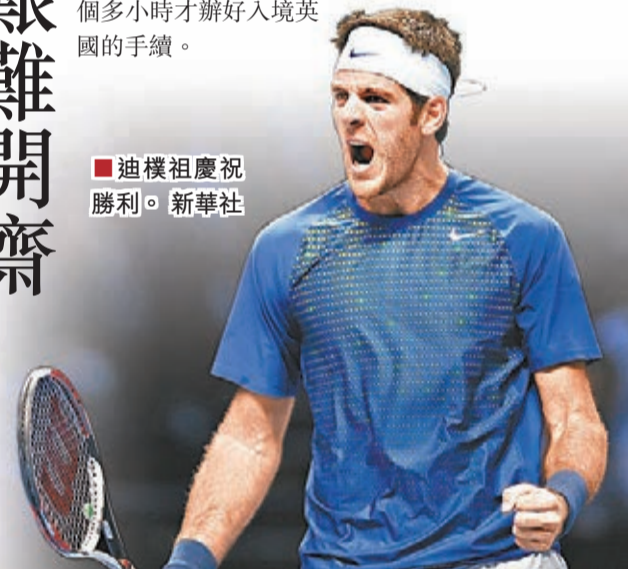
迪樸祖慶祝勝利。

25歲的迪樸祖是參賽的8名選手中最年輕的一位，他曾經在2009年在這裡闖入了決賽。也許是於上周五在巴黎遭遇偷竊受到了影響，他比賽中失誤較多，但好在關鍵時刻把握住機會，經過近兩個小時苦戰過關。迪樸祖上周五在巴黎大師賽之後，在巴黎北站準備乘坐歐洲之星火車到倫敦時護照被偷走，折騰了兩個多小時才辦好入境英國的手續。