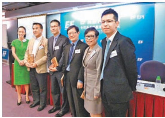
《EF英語能力指標2013》昨公布,香港英語水平下降,與越南、印尼同屬「中級水平」。

示,若論語文能力,內地生未必比香港學生差,是港生的勁敵之一。他又指,其公司10年前並無聘用內地生,但近年已有兩成至三成,估計部分投行更可能有五成,「港生要有危機感,要知道商業社會在變。其實港生還有很多優勢,如視野很闊等,但他們要利用環觀之餘,也要明白國情,平時應瀏覽內地網站,這樣才能提升自己競爭力。現在很多學生連內地一些政府架構都說不出,令我有點擔心」。