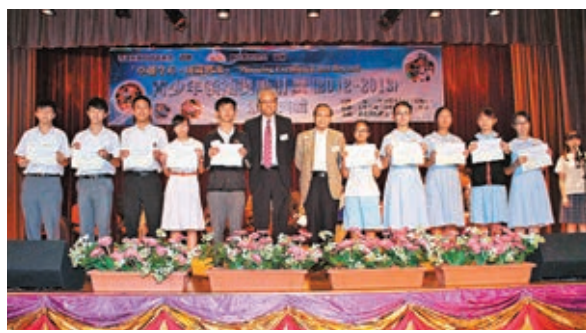
「卓越今天,成就將來」青少年領袖獎勵計劃頒發予60名表現優秀,具領導才能及創新思維的同學。

萬鈞教育基金主席、馮漢柱教育信託基金委員李越挺主禮致辭指,期望得獎同學獲適當培訓,成為社會傑出領袖,並寄語參與學校及獲獎同學藉此組成網絡,互相幫助,未來為香港培育更多優秀人才。由於反應踴