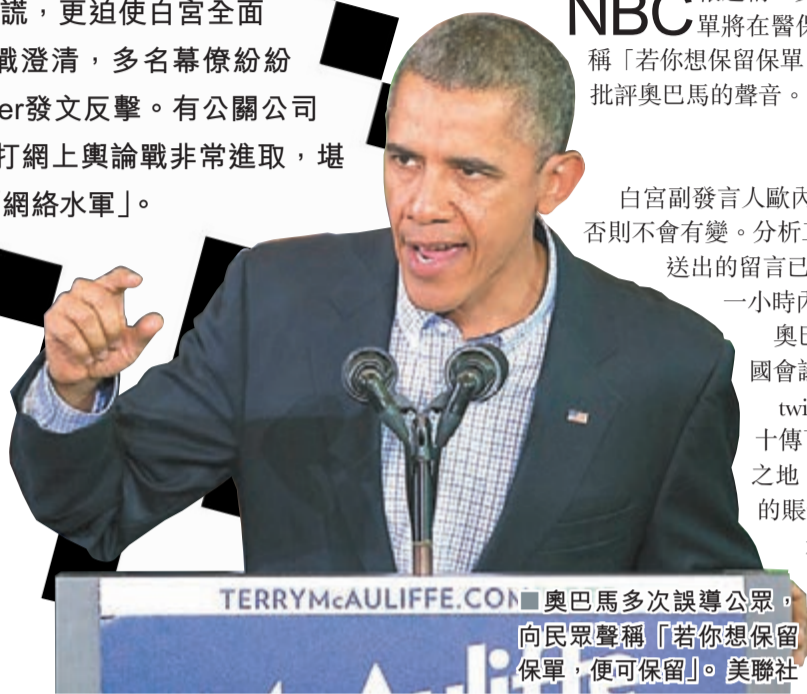
奧巴馬多次誤導公眾，向民眾聲稱「若你想保留保單，便可保留」。

美國醫保網站上月開始運作以來問題多多，華府頻頻撲火，美國全國廣播公司(NBC)日前報道，總統奧巴馬在推銷醫保過程中說謊，更迫使白宮全面發動輿論戰澄清，多名幕僚紛紛在微博twitter發文反擊。有公關公司形容，白宮打網上輿論戰非常進取，堪稱最優秀的「網絡水軍」。