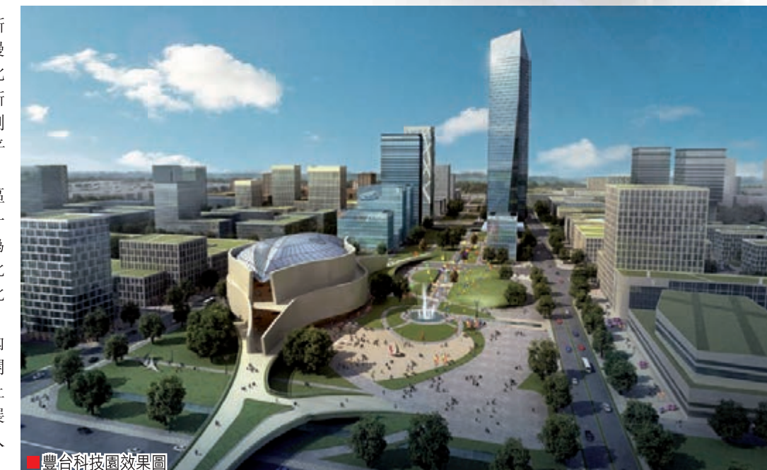
■豐合科技園效果图

香港文匯報訊 包括應急救援科技創新園、二七機車廠、二七車輛廠、首鋼動城、永定河文化創意產業聚集區(包括北區和南區)、麗澤金融商務區7個區域新納入豐合科技園。這樣一來,科技園規劃面積由原來的3.18平方公里擴展到17.63平方公里。 豐合科技園相關負責人介紹稱,該區內,園區在空間上由東區、西區和科技一條街構成,共計8.18平方公里。擴區後,為整個園區乃至豐合區轉變發展方式、優化產業結構以及加速產業的高端化、聚集化發展提供了重要的空間支撐。 除了新增擴區域,園區在原規劃面積內正在加速推進「東擴西進」戰略,重點開發包括東區三期和西區在內的5平方公里土地資源,將建設1,000萬平方米的產業發展空間,可容納一大批大型科技企業總部入駐。