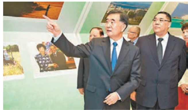
■汪洋與澳門特首崔世安參觀中葡經貿合作論壇成立十周年圖片展。

香港文匯報訊 (本報記者柯景風及綜合報道) 中國-葡語國家經貿合作論壇第四屆部長級會議暨中葡論壇成立十周年慶祝大會活動，今(5)日起一連兩日在澳門舉行。國務院副總理汪洋昨日中午抵澳準備出席論壇活動，並分別會見出席本屆論壇的幾內亞比紹過渡政府總理德巴羅斯、葡萄牙副總理波爾塔斯、東帝汶副總理拉薩馬，禮節性會見巴西副總統特梅爾。