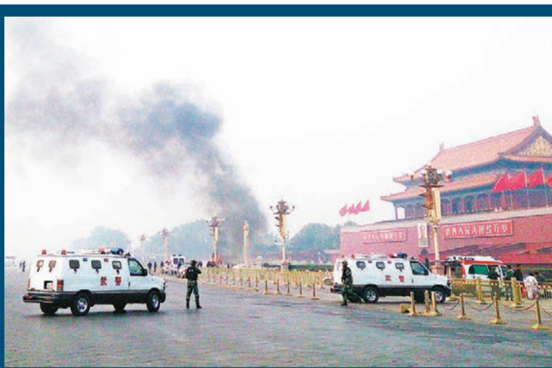
■CNN等少數西方媒體借天安門金水橋暴恐事件搞事，遭到中方嚴厲譴責。 資料圖片

輿論指出，衝撞天安門金水橋事件發生後，法國總統奧朗德及時譴責這一恐怖主義事件，表示慰問受害者家屬。相比之下，CNN所代表的「美國心胸」越來越與那個國家的超級大國地位不相符。