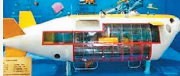
■「小型深海移動工作站」模型。 網上圖片

香港文匯報訊 中國船舶重工集團公司表示，中國首個實驗型深海移動工作站已完成總裝，正在進行調試，並將於近期開展水池試驗。