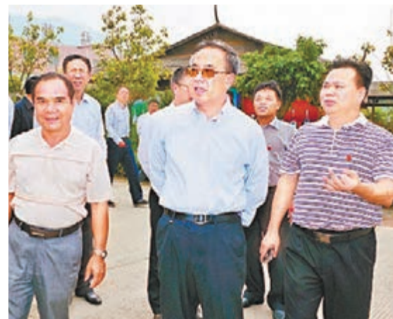
■胡春華3日到清遠市英德大站鎮大藍村考察調研。

胡春華強調，省委、省政府近期決定調整加強珠三角地區與粵東西北地區的對口幫扶關係，以推動粵東西北地區加快發展。幫扶市與被幫扶市都要進一步增強責任意識，全面開展對口幫扶，重點幫助發展，努力實現幫扶發展的目標。要認真貫徹省委、省政府關於進一步促進粵東西北地區振興發展的決定，全力以赴加快發展。