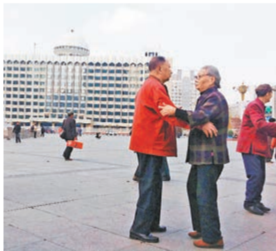
■烏魯木齊市人民廣場，有長者在跳舞，市面一片平靜。