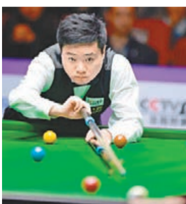
丁俊暉主動出擊。

晚7時30分再戰, 傅家俊狀態大勇, 連追三局反超為7:6。經15分鐘休息、重返賽場後, 二人展開拉鋸, 至本報截稿時間, 戰成8:8不分勝負。香港文匯報記者 陳曉莉