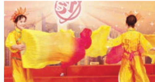
香港晉一中校友文藝隊表演《盛世歡歌》。在典禮上合照留念。