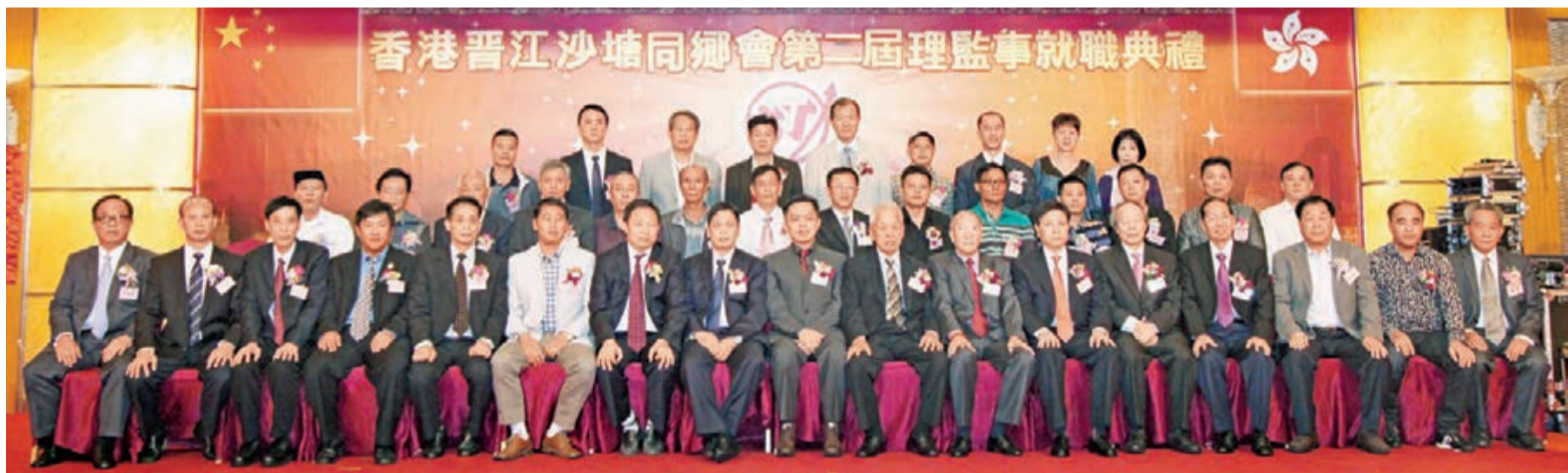
香港晉江沙塘同鄉會慶祝第二屆理監事就職典禮上,新一屆理監事與嘉賓合照留念。