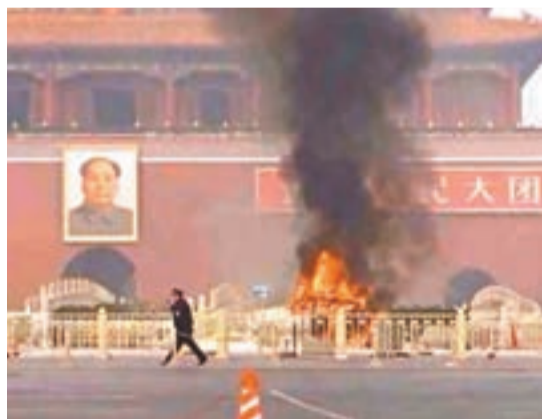
專家表示,北京「10·28」暴力恐怖事件敲響中國各地「反恐」警鐘。

的此次事件造成極大影響,隨着整個社會的發展,交通的便利,人員流動的加劇,未來恐怖主義勢力可能會向大城市蔓延。