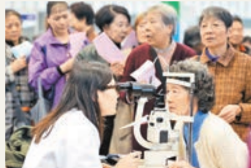
中國老齡人口已超過了2億,每分鐘就有一個人退休。

香港文匯報訊 據《法制晚報》報道,中國正面臨人口老化的問題,老齡人口已超過了2億,每天都有2.48萬人邁入60歲大關,且以每年1,000萬的速度增長。昨天上午,由國務院發展研究中心、全國老齡辦聯合主辦的「2013中國老齡事業發展高層論壇」在北京召開。人社部副部長胡曉義指出,「9月的某一天,中國老齡人口已經超過了2億,每個工作日,社會要為2.48萬人辦理退休,這意味着每分鐘就有一個人退休。」