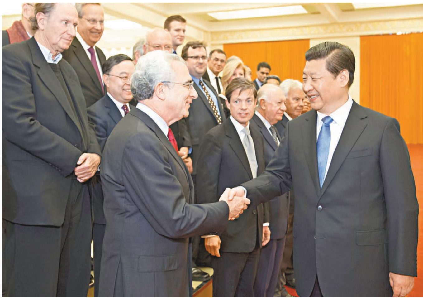
習近平昨日會見21世紀理事會北京會議外方代表,闡述了中國的發展道路、改革開放、經濟形勢和對外政策。

李克強表示,中國是世界經濟的重要貢獻者。中國經濟還會長期增長、持續健康發展下去,轉型中的擴大內需,推進新型工業化、信息化、城鎮化和農業現代化,堅持綠色發展。中國是全球治理的積極建設者。中國致力於維護以聯合國為中心的國際體系,以建設性態度參與和推動相關改革,主張國際關係民主化,希望多哈回合談判等多邊貿易體制繼續向前發展,同時推動區域性貿易投資自由化和便利化。