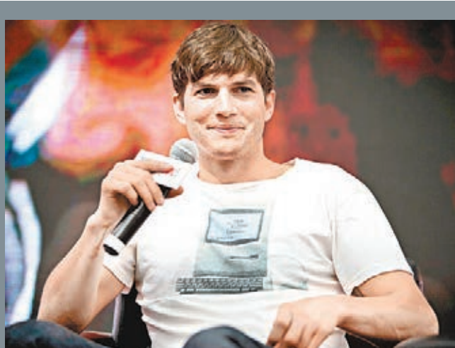
聯想集團委任《喬布斯》當中飾演喬布斯的演員 Ashton Kutcher 擔任形象代言人。