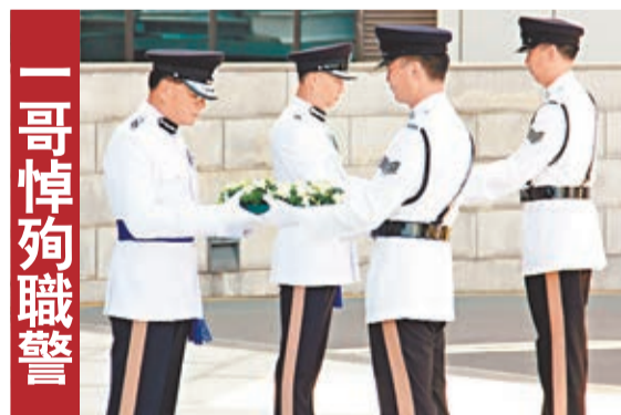
一哥悼殉職警 警務處處長曾偉雄昨日主持警隊紀念日，悼念過去169年因公殉職的香港警隊及輔警人員，對他們的盡忠職守、堅毅不屈表示敬意。曾偉雄致辭時表示，警務人員職責是服務社會及保護市民生命財產，執勤時經常身處險境，生命隨時受威脅，但是警隊從不畏縮，竭盡所能維持社會穩定和安全。警員的努力為警隊贏得美譽，代表着引以為榮的優良傳統，他期望新一代同事薪火相傳。