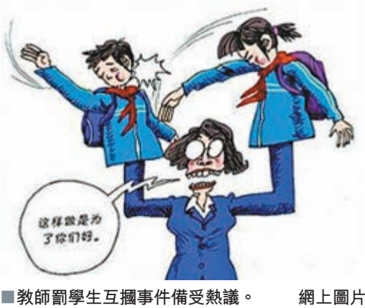
■教師罰學生互擱事件備受熱議。

據家長爆料，因幾名學生午飯時間擅自到室外玩耍惹惱班主任，教師竟要求全班學生同桌之間互扇耳光，而且一桌一桌輪着互扇，掌擱得不響的還由該教師親自動手，多名女生被打哭。但體罰後似乎還沒能讓他消氣，最後全班同學被勒令中午不准吃飯。該教師曾被評選為該校2013年度上學期優秀教師，其事後承認一時衝動，坦承非合格教師，並借媒體向學生及家長道歉。