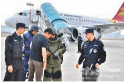
■有關當局派員進行排爆檢查。

從昨天中午開始，陸續有旅客通過微博發布信息，稱自己所乘航班疑似有爆炸物，這些航班均為長沙進出港航班。據乘坐首都航空JD5662長沙飛杭州的旅客微博描述，當時飛機備降南昌機場，現場出動防暴隊伍，疏散了飛機上的乘客後，就進行排爆檢查，之後沒有發現異常，該航班準備繼續起飛。