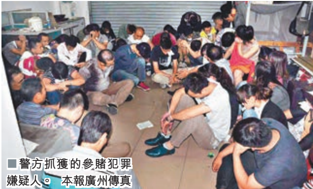
■警方抓獲的參賭犯罪嫌疑人。本報廣州傳真

香港文匯報訊（記者 敖敏輝 廣州報道）廣州警方近日在虎門大橋附近搗毀一個特大地下賭場，抓獲64人，繳獲籌碼逾3,500萬元。該賭場的專業化和精細化程度都堪比澳門賭場：賭場在南沙街東井村一倉庫以隔板隔出，隱密性極佳；入口設置金屬探測安檢門，參賭人員必須由賭場專車接送，在高速公路口和賭場五百米內均安置大量看風人員。