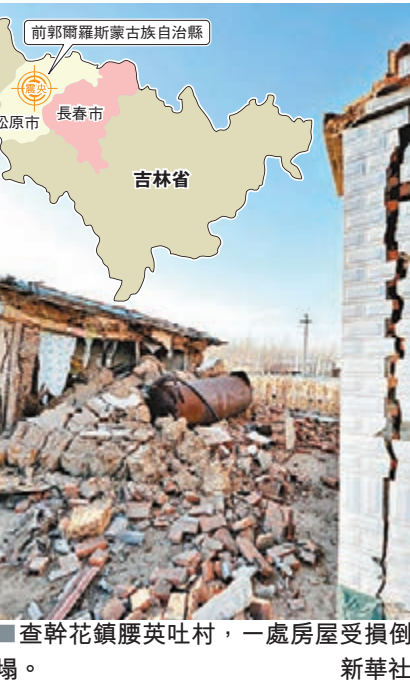
■查幹花鎮腰英吐村，一處房屋受損倒塌。

黑龍江省地震局主任趙誼指出，此次地震發生前，9月2日西太平洋內和9月28日俄羅斯境內發生兩次地震，10月30日，在吉林省汪清縣發生5.3級深震，加上此次地震共四次地震，都是由西太平洋板塊向下俯衝引起的。據介紹，此次地震不會導致地磁信號消失，通訊無信號跟地震無關。