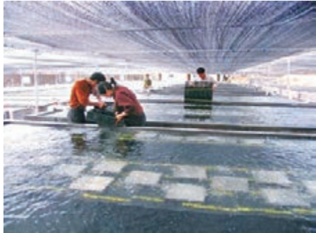
■福建的南日鮑、長樂鰻鱺等優質水產都採用現代化養殖技術，多元化發展，圖為福建的陸上鮑魚養殖場。

海洋與漁業廳獲悉，福州市還計劃投資2億元建設長樂市鰻鱺養殖園區，推行現代化循環水養殖新技術，力爭打造成高科技園區。