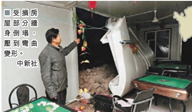
■受損房屋部分牆身倒塌，壓到彎曲變形。

到記者發稿為止，2000個帳篷和配套的被褥等生活用品已發放到居民手中，並正在協助安裝帳篷和發放食品。現在有關部門的領導正在受災比較重的村落視察房屋情況並安置居民，在災情較重的乾安縣，政府各部門和當地居民正在搭建