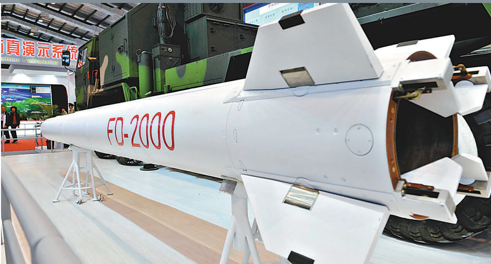
■國產FD-2000防空導彈武器系統。資料圖片

早在9月26日，土方曾宣佈中國的反導系統中標。然而土耳其立即遭到來自美國、歐盟和北約高層的強大的政治壓力。部分西方媒體更大肆渲染，指中國武