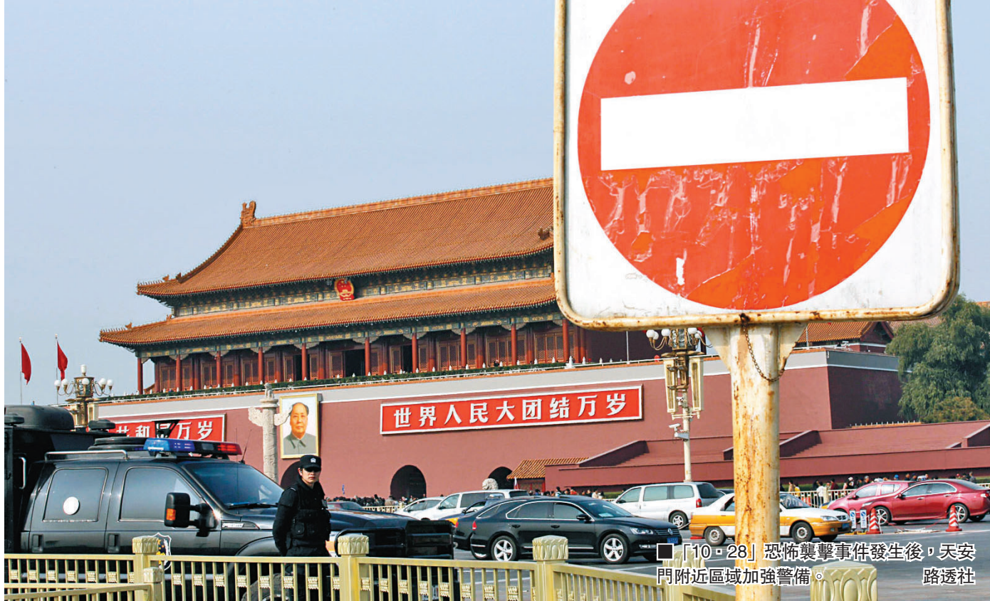
■「10·28」恐怖襲擊事件發生後，天安門附近區域加強警備。

李偉表示，該案件發生後，天安門附近區域將加強安保管理，相信三中全會召開期間，恐怖襲擊的行動能力將受限。他建議中國政府加大完善反恐法的力度，不僅局限於以威懾為立法原則，而是重在預防，力求在恐怖襲擊實施之前挫敗其企圖。同時還應注意相關情報收集，提升預警防範能力。