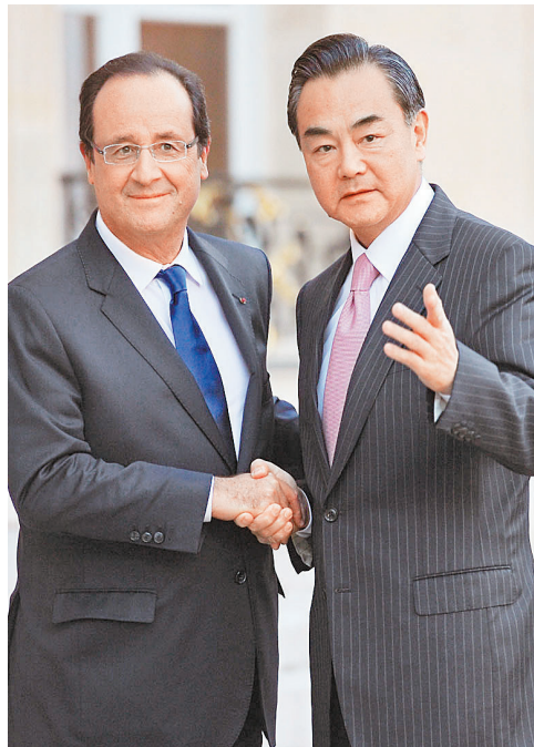
■法國總統奧朗德（左）前日在巴黎會見王毅。

香港文匯報訊（記者 葛沖 綜合報導）北京天安門「10·28」恐怖襲擊事件前日告破，中國政府今後會否加大反恐力度備受關注。國防部新聞發言人楊宇軍昨日重申，中國軍隊在必要時，將根據國家統一部署，打擊各種暴力恐怖活動。外交部發言人華春瑩強烈譴責事件是反人類、反社會行徑。法國總統奧朗德在巴黎會見中國外交部長王毅時對事件亦予以譴責，並對遇難者表示哀悼。