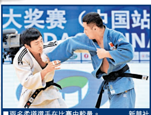
■兩名柔道選手在比賽中較量。

羅馬尼亞選手卡普里奧留在30日的最後一場決賽，女子57公斤級決賽中戰勝巴西選手席爾瓦奪得金牌。