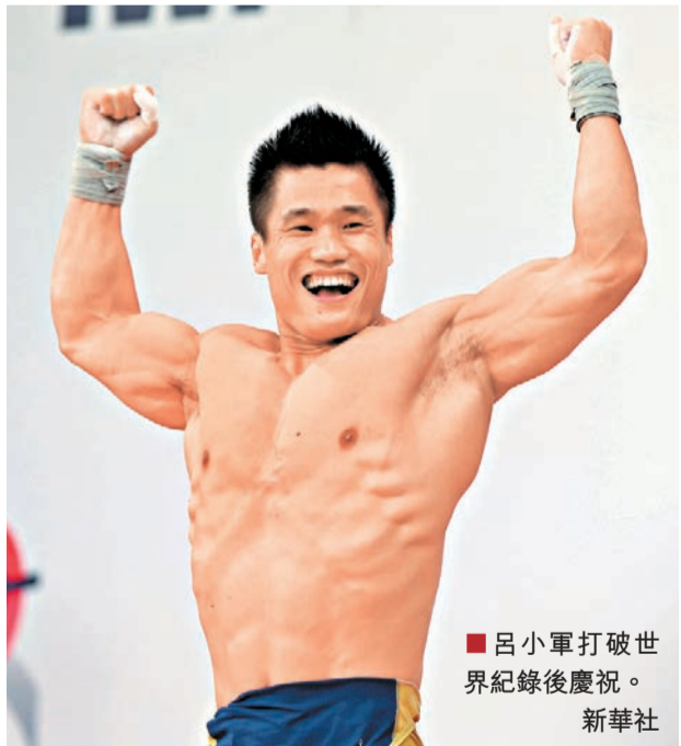
■呂小軍打破世界紀錄後慶祝。

談到男子舉重目前的世界格局，陳文斌認為中國隊可以保持謹慎的樂觀。「從4個小級別來看，中國隊在56和62公斤級的最強對手依然是朝鮮；69和77公斤級，我們目前的成績如果能保持到里約，就有衝金的把握。4個大級別我們與外國選手差距較大，人才儲備也相對有限，不過我們不會放棄。距離里約奧運還有兩年半時間，我們會竭盡全力保住優勢級別，尤其是69、77公斤級要絕對保住。而在56和62公斤級上，我們會加大力度好好研究，找到突破點，」陳文斌說。