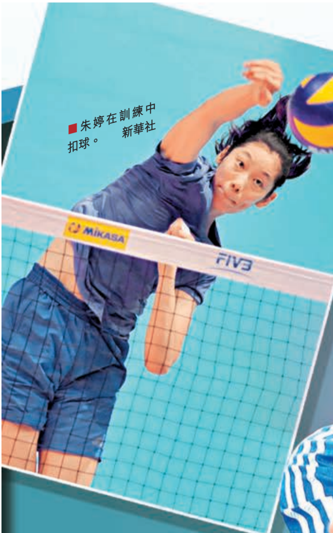
■朱婷在訓練中扣球。