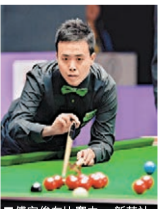
■傅家俊在比賽中。

30日，2013年世界桌球國際錦標賽在四川成都繼續進行。在16強大戰中，中國16歲天才小將趙心童雖然頻頻打入精準遠台，無奈經驗欠缺而得分不多；最終，香港名將傅家俊贏6：2，殺入8強。賽後，傅家俊表示，這場比賽與他此前想的如出一轍，就是一場「進攻大戰」，「和趙心童打比賽，我之前的預計是一場『進攻大戰』，我覺得自己的得分能力也是不錯的。趙心童也不會打太多的防守，有時拚得比較厲害，打不進的話就留給我機會。」