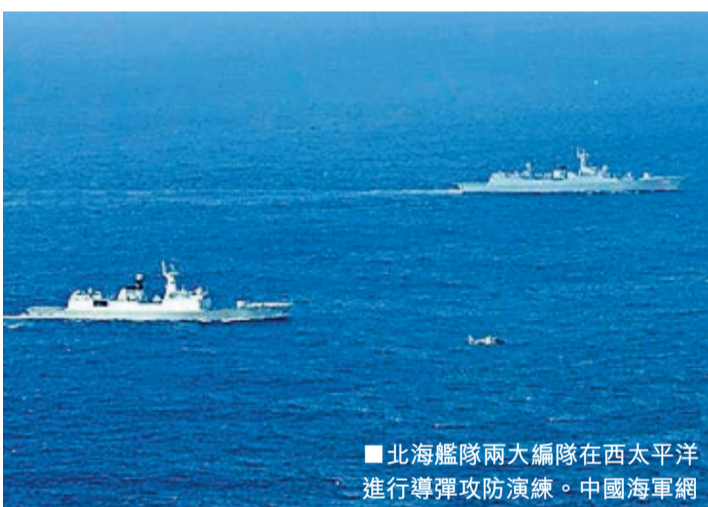
北海艦隊兩大編隊在西太平洋進行導彈攻防演習。中國海軍網

此次演習紅方兵力由導彈驅逐艦青島艦和導彈護衛艦臨沂艦組成，藍方兵力由參加海軍「機動-5號」導彈驅逐艦石家莊艦、瀋陽艦和導彈護衛艦煙台艦擔任。演習全程隨機導調，不設預案，參演雙方以背靠背方式自主進行對抗。