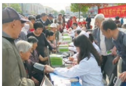
今年1月至7月，合肥高新區共救助城鄉大病患者314人次。其中，一站式救助132人次，救助資金45.6萬元。圖為高新區組織醫護人員為居民開展「義診」。

合肥高新區近年來以「以民為本、替民解困、為民服務」為工作宗旨，構建社會救助、社區服務、養老服務等為主體的現代綜合民政，實現了由單一傳統民政民生工程向現代綜合民政民生工程的轉變。