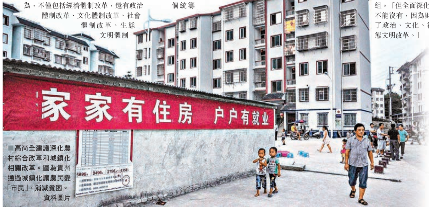
高尚全建議深化農村綜合改革和城鎮化相關改革。圖為貴州通過城鎮化讓農民變「市民」，消滅貧困。資料圖片