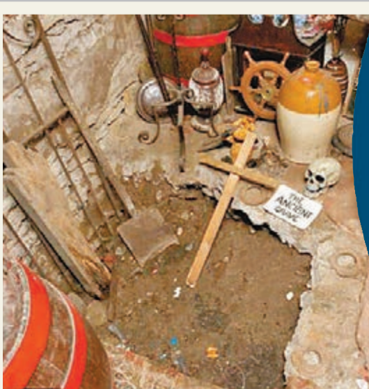
■據稱旅館在翻新時，從地下挖出骨塊。網上圖片