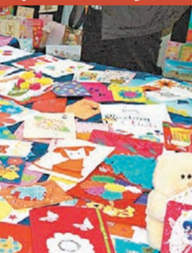
■色彩繽紛的賀卡，滿載了各地網民的心意。網上圖片