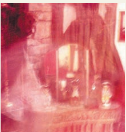
■房間內曾拍到「鬼魂」走過。網上圖片

明天是萬聖節，想試試撞鬼的人大可到英國最猛鬼民宿「Ancient Ram」入住。民宿位於格洛斯特郡，建於1145年，地基相傳是古代宗教信徒的墓地，更可能發生過活靈獻祭和魔鬼崇拜。內裡據稱住了20隻鬼，曾有住客看見傢具飛行，又見過小女孩在走廊徘徊，有住客嚇得從1樓窗戶跳到地面。