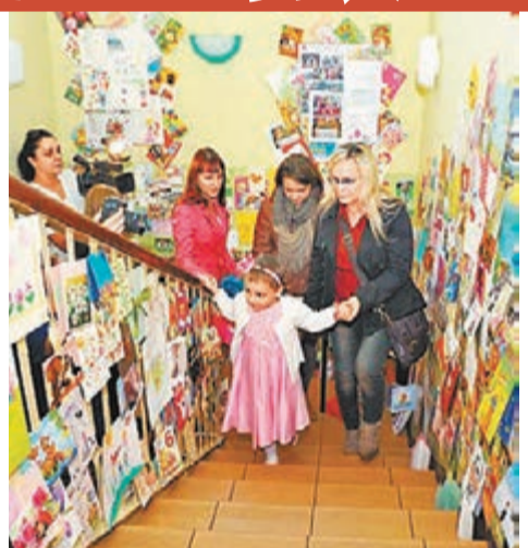
■甘德茨卡的家中樓梯貼滿生日賀卡。