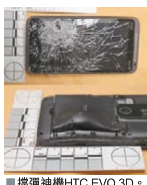
■擋彈神機HTC EVO 3D。

美國佛羅里達州一個加油站前日發生離奇搶劫案。一名劫匪朝加油站職員開槍，職員竟只受輕傷，原來子彈打中他胸口的HTC(宏達電)手機。HTC昨證實這款擋彈神機是旗下EVO 3D，但不建議公眾模仿。