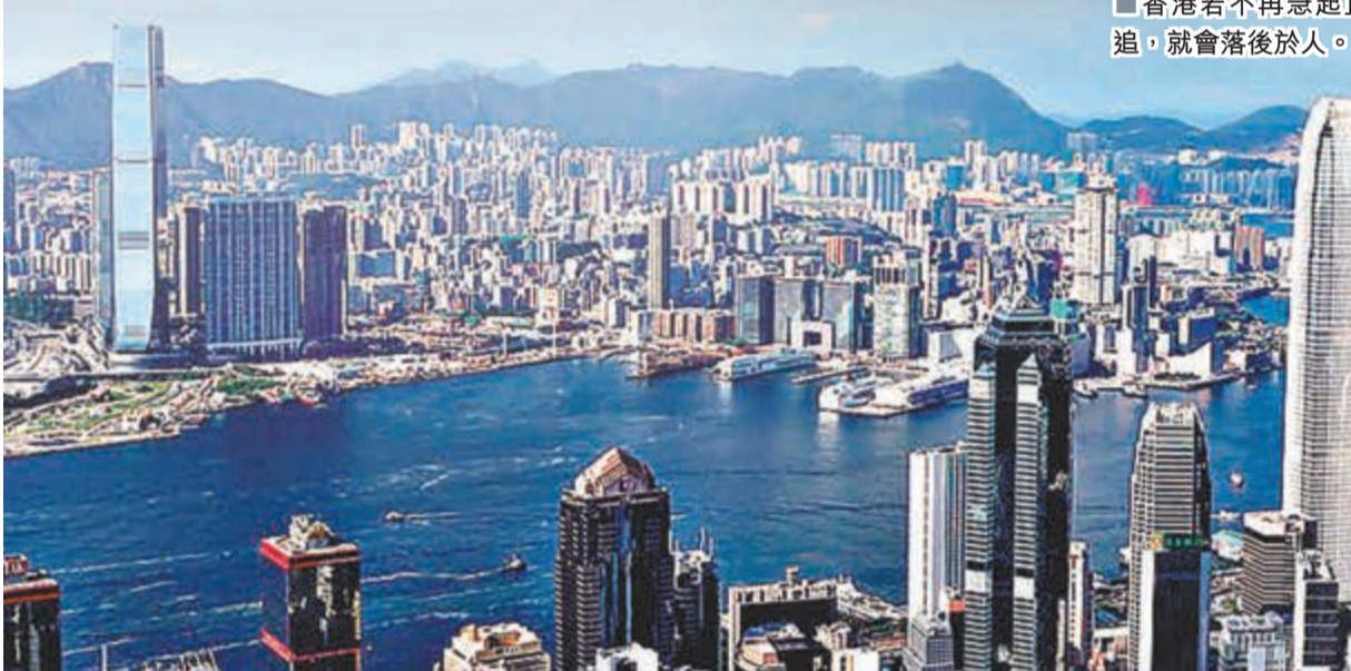
香港若不再急起直追，就會落後於人。

瑞穗證券亞洲首席經濟學家沈建光接受本報採訪時則指出，對比起上海自貿區，深圳前海更着重與香港的金融合作，是香港服務業的延伸。國家的一些政策將在前海先試，譬如私募基金的就在前海進行試驗，這有利於增強前海和香港的競爭力。目前香港在基金管理方面有很多優勢，與前海結合，將有利於將這種優勢向內地拓展。