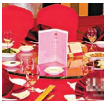
湖南將實施最嚴「限宴令」，有少數幹部突擊操辦酒宴。

香港文匯報訊（記者 李青霞 長沙報道）被網評為湖南史上最嚴「限宴令」將於11月1日起施行。在湖南部分地區，少數幹部職工卻突擊操辦酒宴，有的連房子都還沒建好就操辦了喬遷宴。