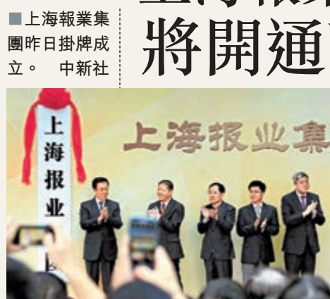
上海報業集團昨日掛牌成立。

香港文匯報訊 由解放日報報業集團和文匯報聯合報業集團整合重組的上海報業集團，28日正式掛牌成立。中共中央政治局委員、上海市委書記韓正為集團揭牌。剛剛成立的上海報業集團與百度公司簽署協議，雙方宣佈就合作共同運營百度新聞「上海頻道」達成一致。