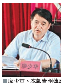
廖少華。本報貴州傳真

今年53歲的廖少華是四川遂寧人。長期在貴州工作，曾任共青團貴州省委書記、六盤水市委副書記、六盤水市市長、黔東南州委書記等職。今年1月起，升任貴州省委常委，遵義市委書記，遵義軍分區黨委第一書記。