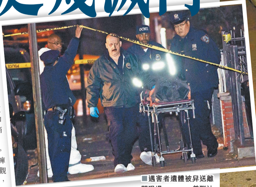
遇害者遺體被昇送離現場。