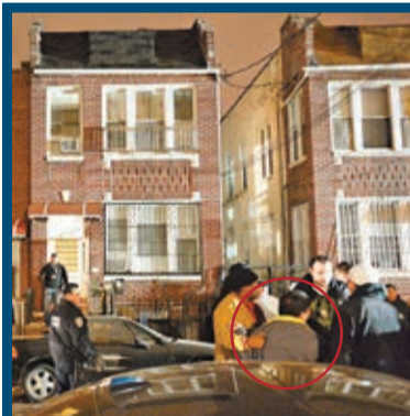
男戶主得悉妻子和4名兒女遇害，激動抓着身旁男子。