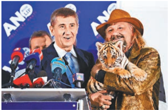
動物園東主帶來老虎BB祝賀巴比(左)。

捷克大選前日結束，中間偏左的最大反對黨社會民主黨得票最多，但未過半數，至於捷克第2大富豪巴比什領導、大反貪旗號的「不滿公民行動黨」(ANO)得票排第2，共產黨則排第3。社民黨需與其他政黨籌組聯合政府執政，令巴比什有機會成為混亂政局下的「造王者」。