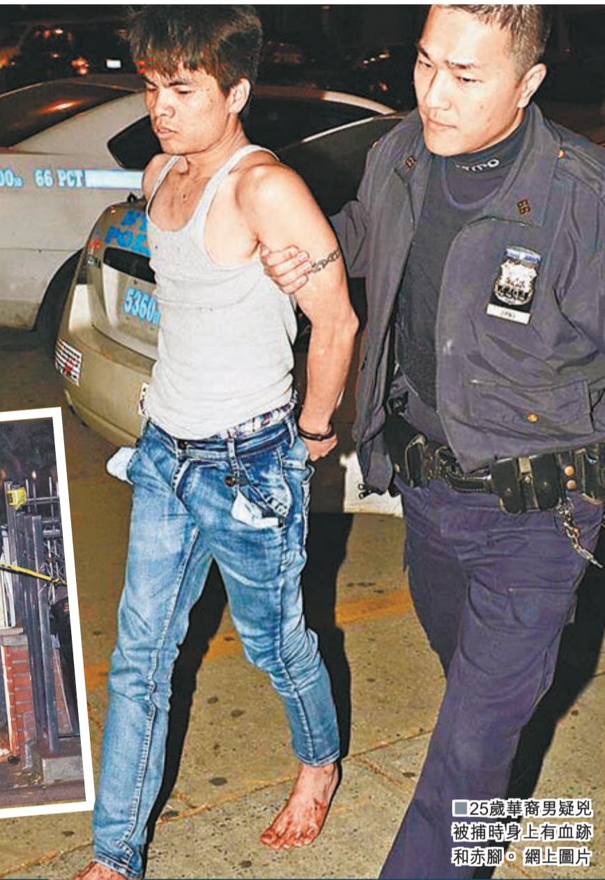
25歲華裔男疑兇被捕時身上有血跡和赤腳。