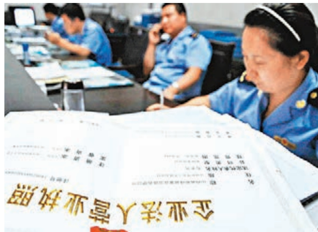
國務院部署放寬註冊資本登記條件。 網上圖片

會議強調，改革註冊資本登記制度涉及面廣、政策性強，要抓緊依照法定程序推進相關法律法規的修訂工作。要強化企業自我管理、行業協會自律和社會組織監督的作用，提高市場監管水平，切實讓這項改革舉措「落地生根」，進一步釋放改革紅利，激發創業活力，催生發展新動力。