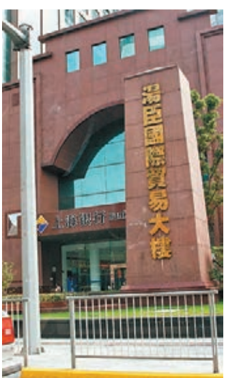
自貿區內的湯臣國際貿易大樓租金一夜翻一倍，目前無房可租。