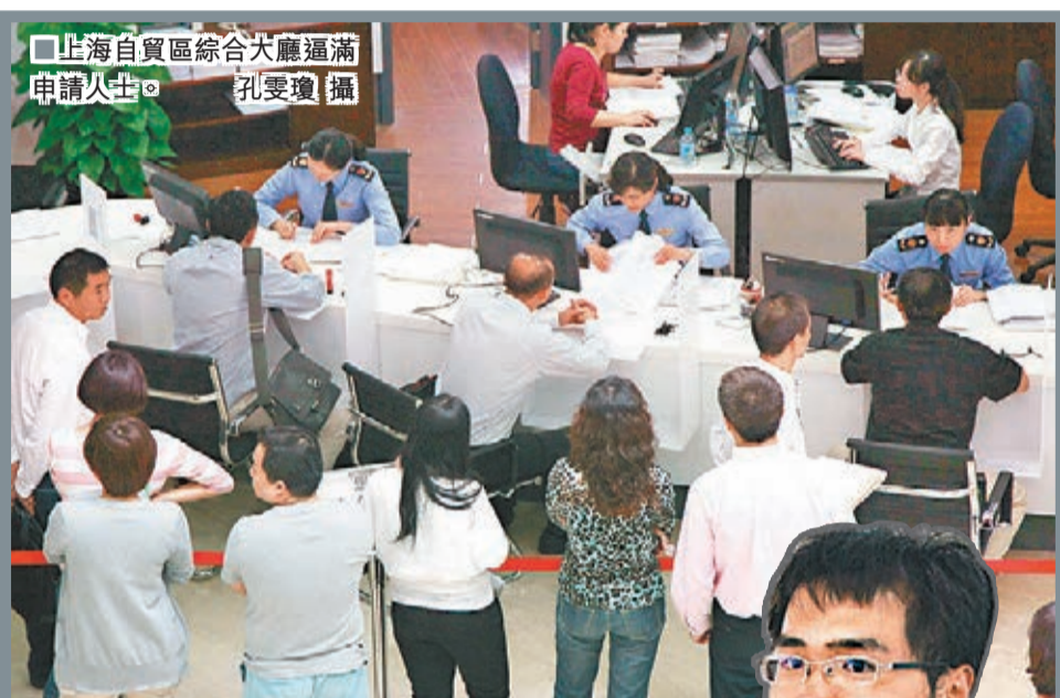
上海自貿區綜合大廳滿申請人士。