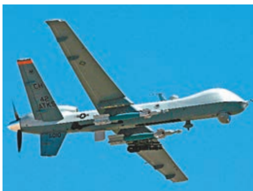
聯合國預計愈來愈多國家使用無人機，若無規則監管，只恐令更多無辜平民受害。

負責法外處決問題的特別報告員海因斯以「自衛」為依據，認為無人機攻擊是合法的，但同時也對國際人道法、人權法不能得到遵守表示擔憂。經常被美國無人機在境內施襲的巴基斯坦，其常駐聯合國代表強調「巴國從未明確允許或默許」美無人機行動，要求美國立即停