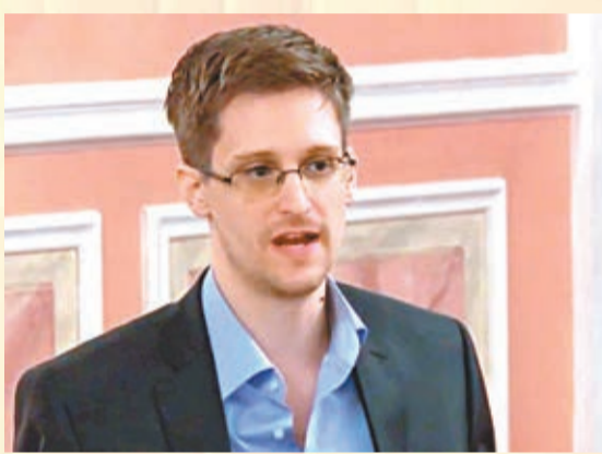
斯諾登揭露美國的監控計劃，卻被指是洩密資敵。資料圖片

英國《衛報》前日引述美國中情局前職員斯諾登取得的機密文件，指英國政府通訊總部(GCHQ)明知大型監控可能違法，仍然百般瞞騙，令公眾蒙在鼓裡，從而避免引起「破壞性」反響。文件揭露多家電訊公司與GCHQ狼狽為奸，所提供的數據或監管道遠超法律要求。