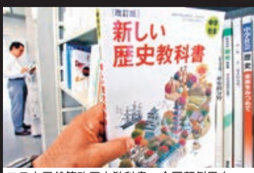
日本居然篡改歷史教科書，企圖顛倒黑白。 資料圖片

日本 亡靈不分善惡： 日本一些政客強調，中日兩國的生死觀不同。中國人認為若生前做壞事，死後應遭唾罵，杭州岳廟前謀害岳飛的奸臣秦檜跪像就是典型例子。日本人則認為人亡不究魂之過，在該國文化中，亡靈不分善惡。譬如，日本人曾為入侵的元朝軍隊將士立碑，為日俄戰爭中戰死的俄軍將領立碑。