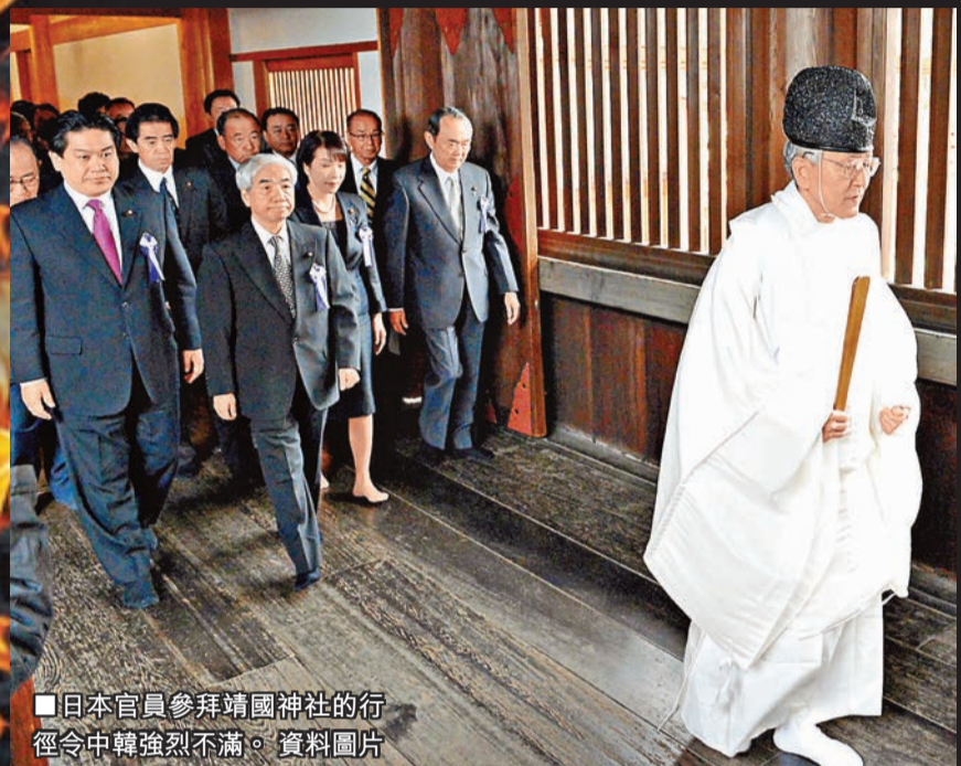
日本官員參拜靖國神社的行程令中韓強烈不滿。 資料圖片