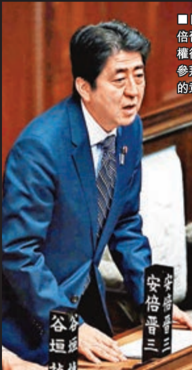
日本首相安倍晉三重新掌權後不斷釋出參拜靖國神社的意慾。 資料圖片