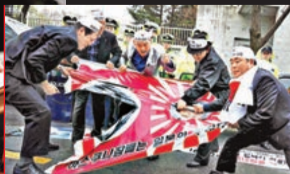
韓國民眾撕毀日本軍國主義旗幟，抗議日本國會議員參拜靖國神社。 資料圖片