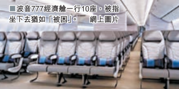
波音777經濟艙一行10座，被指坐下去猶如「被困」。網上圖片