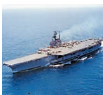
「佛瑞斯塔」號1967年在東京灣外連環爆炸，造成134名美軍死亡。

「佛瑞斯塔」1954年下水，是當時海軍最大艦艇，曾參加不少軍事行動，1967年在越南海域附近東京灣外，因技術故障連環爆炸，造成134名美軍死亡，共和黨資深參議員麥凱恩是幸存者之一。該艦在費城的碼頭停泊20年，變得鏽跡斑斑，軍方曾試圖將它改建成浮動博物館。綜合報道