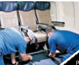
西南航空技工上月向其波音737客機經濟艙開刀。

覺得飛機經濟客位愈來愈窄？可能並非心理作用。《華爾街日報》報道，很多航空公司為加大商務艙和頭等艙面積，不惜進一步壓縮經濟艙空間，但為了載客量不減，竟同時增加經濟客位行數和每行座位數目，使經濟艙愈見逼狹。有乘客形容，經濟座位窄得「猶如被困」。