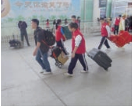
■身著紅馬夾的布吉義工已成為深圳東站一道靚麗的風景。

1、開展城市管理專項整治行動。對東站周邊10條重點城市主次幹道沿線進行全面清查，規範片區內招牌廣告懸掛，全面清理片區內亂搭建、亂停車、亂張貼、亂倒泥渣渣土行為，全面治理片區亂擺賣、佔道經營、超門線經營、無證照經營等行為；對周邊區域進行深入摸底，擇址試點設置「流動商販臨時疏導區」，限定擺賣物品，分地段、分時點引導擺賣，防止違法擺賣現象回潮。 2、開展環境衛生專項整治行動。對東站周邊百餘路等19處地段或社區及時清掃，確保市政環衛設施運轉正常；對破損路面、人行道等市政設施進行修復。確保路面、人行道等市政設施進行修復。確保路面、人行道等市政設施進行修復。 3、開展交通綜合整治行動。以長龍片區交通微循環改造項目為先導，對東站周邊道路交通標誌等交通設施開展全面整治；調整部分區域交通微循環，增設停車場和停車位；通過宣傳、勸導等方式，營造交通文明氛圍。加大東站周邊交通管理的科技投入，提高對路面違法行為的管控能力。 4、開展社會治安專項整治行動。對東站周邊歌舞娛樂、桑拿洗浴和旅業等行業場所進行分類管理，疊加檢查，嚴查違法違規場所；每周確定一個行動重點，集中開展以打擊兩搶兩盜、詐騙、非法營運等違法犯罪行為的綜合執法行動；爭取增加片區3個派出所的警力，緩解治安壓力，並組織周邊社區網絡治安員、民兵等成立群防群治小組，解決警力不足問題。 5、開展安全隱患排查專項整治行動。對深圳東站周邊的9個社區依托網格化管理，重點對工廠商貿、消防、建築施工、危險化學品、高層樓宇地下建築、醫院、學校、「三小」場所等易發生安全事故的行業和領域開展安全隱患排查整治，確保東站周邊不發生較大的安全事故。