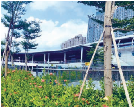
■與深圳東站相連的深圳地鐵站——布吉站