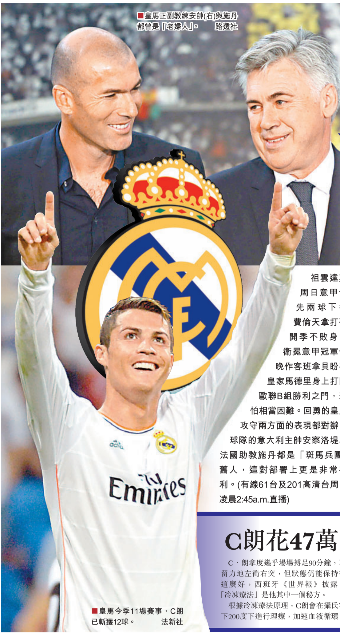
皇馬正副教練安帥(右)與施丹都曾是「老婦人」。