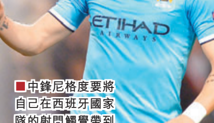
中鋒尼格度要將自己在西班牙國家隊的射門觸覺帶到曼城。