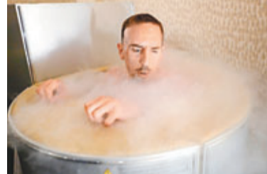
去年歐國盃，列利利等法國球星透過超低温冷凍桑拿來促進血液循環。