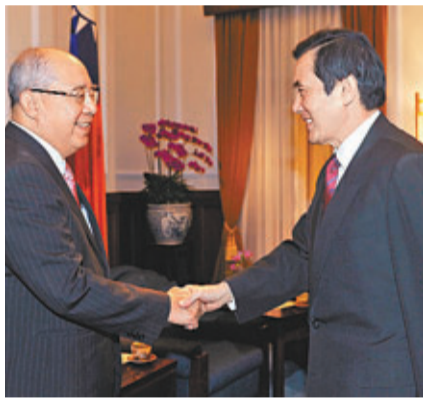
馬英九(右)接見吳伯雄(左)。

「富味鄉」昨日發布新聞稿表示，其所製的精煉棉籽油全數外銷，未進入台灣市場；近4000公噸棉籽油外銷至香港、新加坡、菲律賓等地。