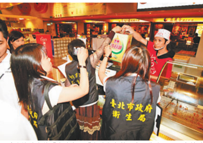
除直接涉事的「大統」及「富味鄉」外，台北衛生局人員亦抽驗飲食業者使用的油品。

台灣衛生部門則指有關說法嘩眾取寵，重申棉籽油只要精煉萃取，就屬於合法的食用油。過去衛生部門雖多次檢驗大統的油品，但卻無法發現問題，官員稱「業者調配手法太高超！」