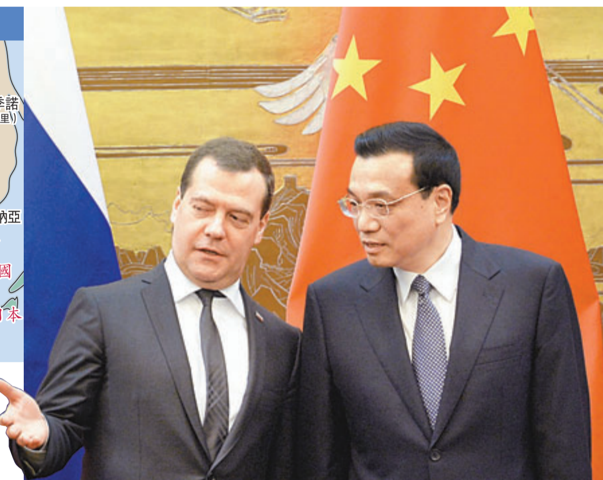
■ 中俄總理李克強(右)與梅德韋傑夫出席兩國能源、教育、金融等領域20項合作文件簽署儀式。

今年3月，俄氣公司與中石油簽署了一份關於東線管道對華供氣項目的諒解備忘錄。俄氣總裁米勒當時表示，俄氣公司通過「西伯利亞力量」輸氣管道可從2018年開始供氣，供氣量為每年380億立方米，可以增加至600億立方米。