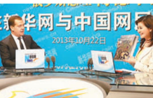
■ 梅德韋傑夫(左)與中國網民線上互動。