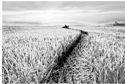
金色的秋。

片片落葉飄蕩於瀟瀟秋水之上，秋風有節奏地舞動着金色的葉子，像一張張馳騁的船帆，獨立行走於鄉村的田園與河流之上，美觀無聲。仔細端詳鄉村秋天的模樣，萬物充盈着豐碩的臉龐。熟稔的果園中掛滿了果農的笑臉，魚躍的池塘裡盛滿了漁人的喜悅，金色的稻海中洋溢着莊稼人爽朗的笑聲。