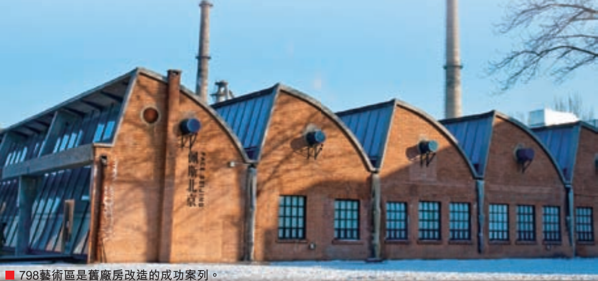
■798藝術區是舊廠房改造的成功案列。