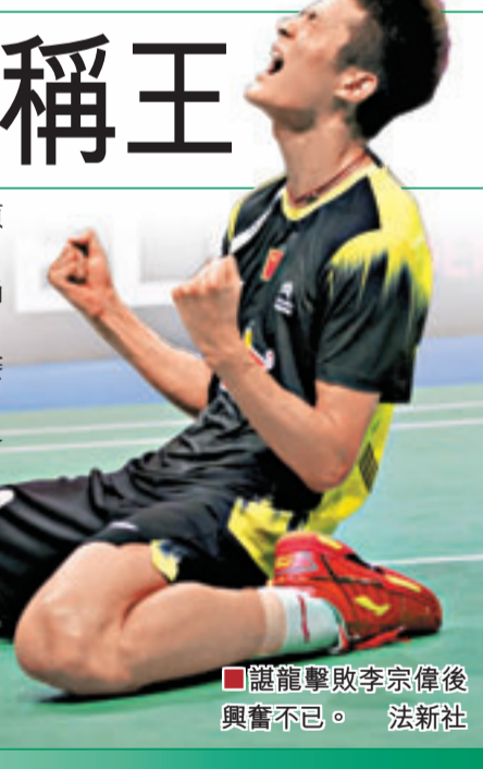
諶龍擊敗李宗偉後興奮不已。

在隨後進行的混雙決賽與女雙決賽中，中國組合張楠/趙芸蕾、湯金華/包宜鑫均以2:0輕鬆戰勝對手印尼組合阿瑪德/納西爾和東道主丹麥組合彼得森/尤爾，成功奪冠。