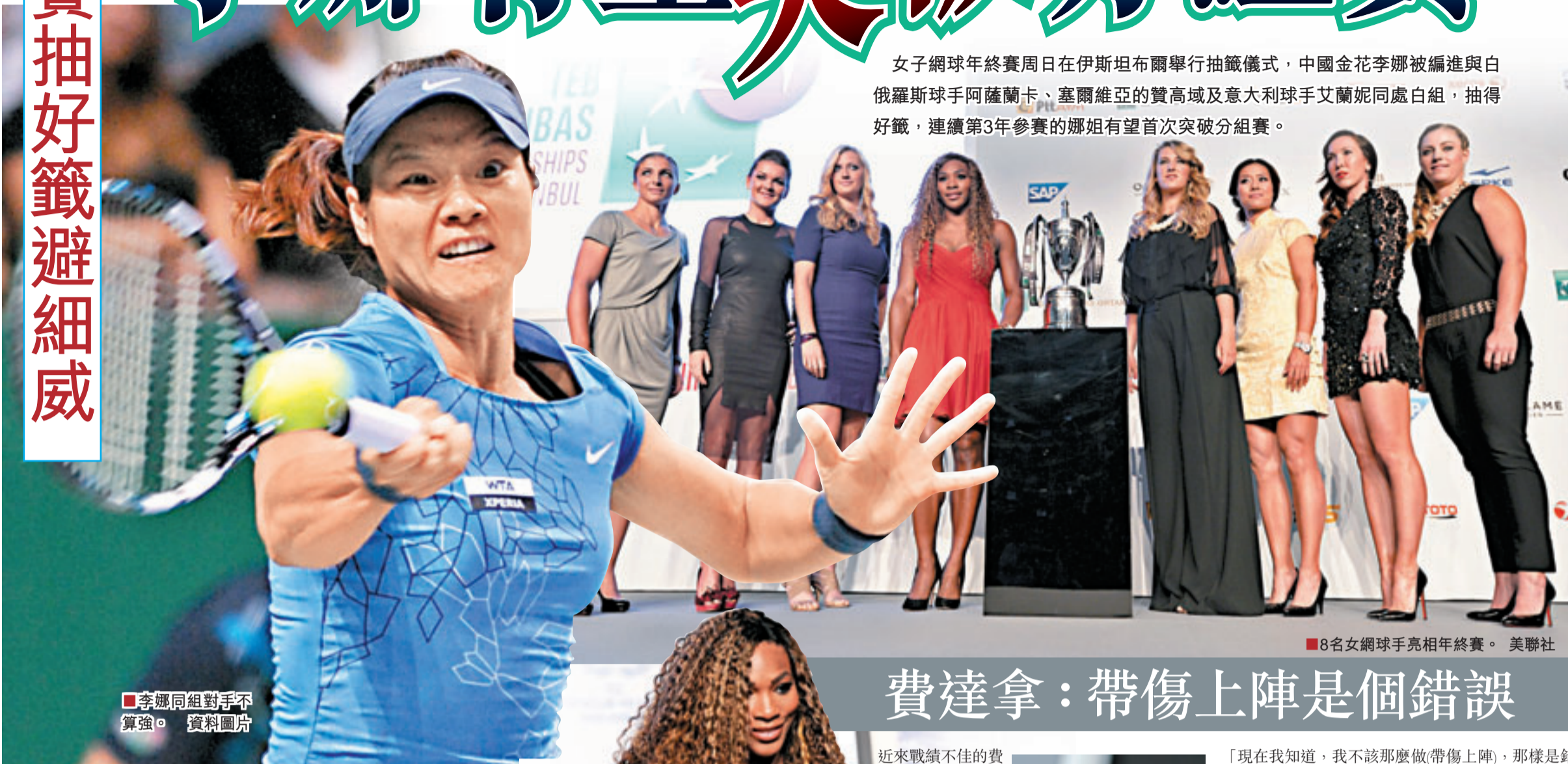
8名女網球手亮相年終賽。

女子網球年終賽周日在伊斯坦布爾舉行抽籤儀式，中國金花李娜被編進與俄羅斯球手阿薩蘭卡、塞爾維亞的贊高域及意大利球手艾蘭妮同處白組，抽得好籤，連續第3年參賽的娜姐有望首次突破分組賽。