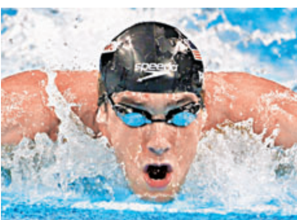
菲比斯目前已重返泳池訓練。

菲比斯正在美國一家游泳俱樂部進行訓練，但他和教練都沒有透露是否或何時會參加正式比賽。