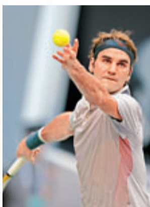
費達拿後悔帶傷上陣。資料圖片

有傷的情況下，參加了今年3月的印第安韋爾斯大師賽，以及7月的漢堡公開賽和瑞士公開賽。目前世界排名跌至第7位的費達拿說：