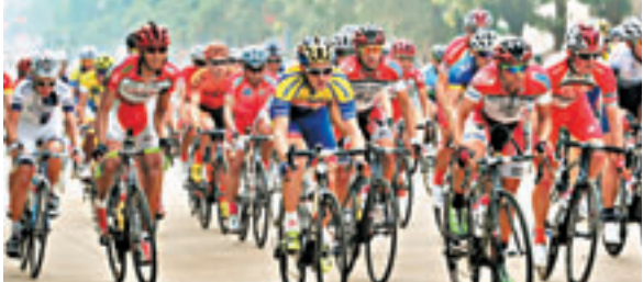
環島賽昨進行第二賽段。

22日，環島賽將進入第三賽段海口—瓊海的爭奪，該賽段全程148.8公里，共設有3個中途衝刺點。