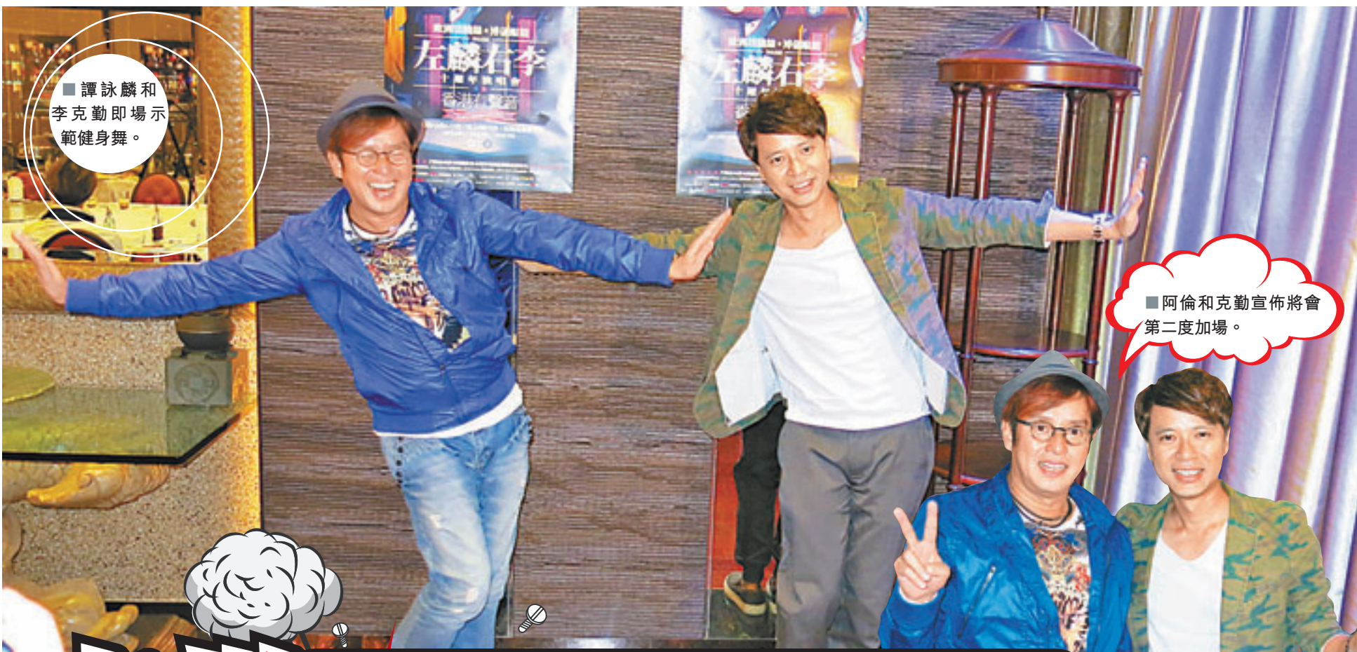
譚詠麟和李克勤即場示範健身舞。