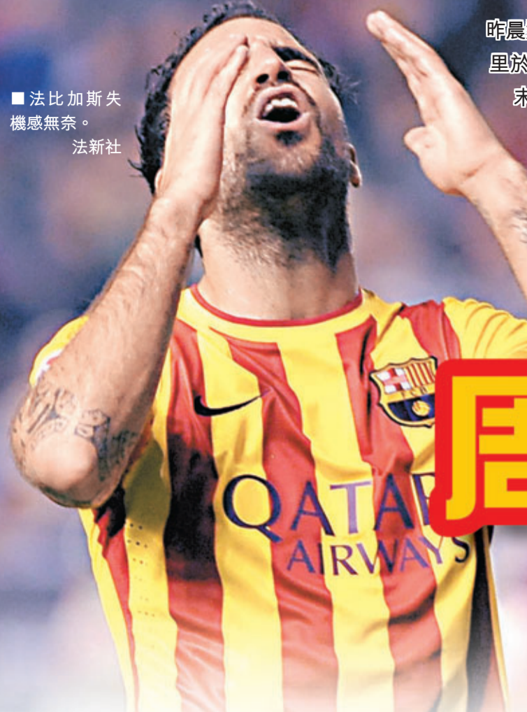
■法比加斯失機感無奈。

昨晨遭奧沙辛拿守和0:0，巴塞羅那錯失追平皇家馬德里於1968/69球季保持的西甲開季9連勝紀錄。本周末西甲大戰，衛冕冠軍便要硬撼皇馬，對於錯過下輪踩在宿敵身上打破對方紀錄的機會，主帥馬天奴並不關心。不過，西班牙《馬卡報》認為，今輪賽果難免會讓巴塞洩氣，為皇馬打下強心針。