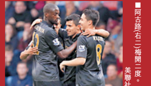
■阿古路(右)梅開二度。