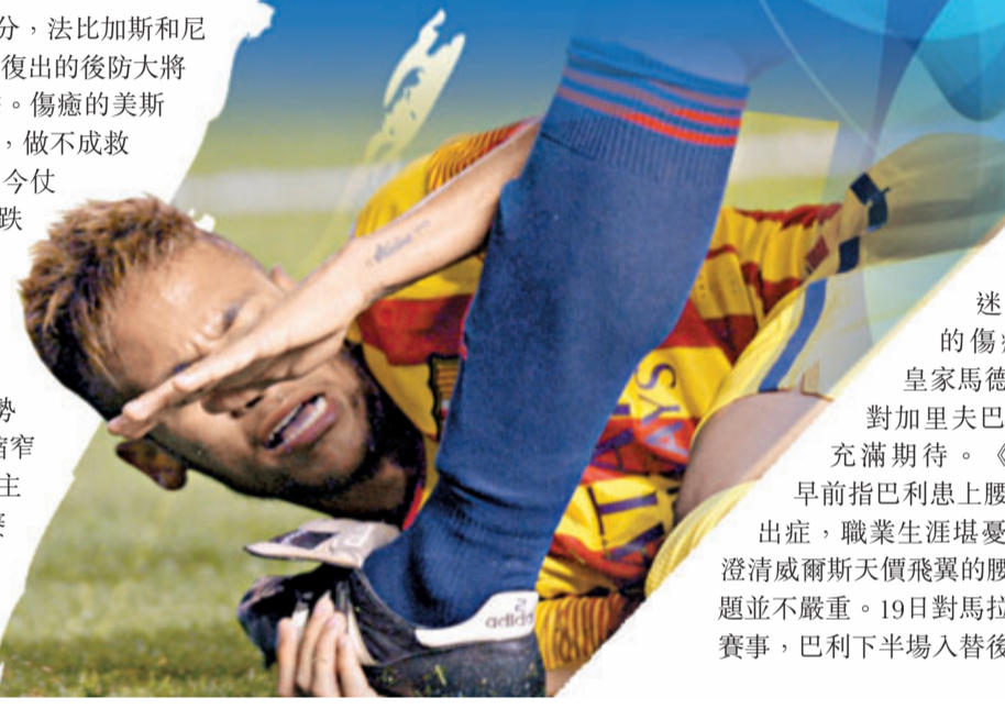
■尼馬慘被踩手。