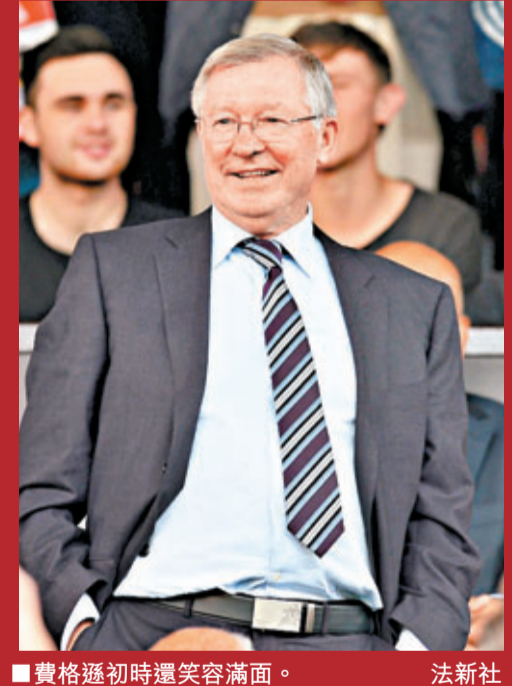
■費格遜初時還笑容滿面。

正是領隊莫耶斯幾個值得商榷的爭議換人，導致了曼聯19日完場前被修咸頓逼和1:1。莫帥堅持將進攻中場香川真司與後備殺手查維亞靴南迪斯放在後備席，六十多分鐘時更選擇用老將傑斯入替今仗狀態不錯的翼鋒拿尼。之後分別以韋碧克與基斯史摩寧換走費蘭尼跟朗尼這兩位可攻可守的主將，也沒起到理想效用。