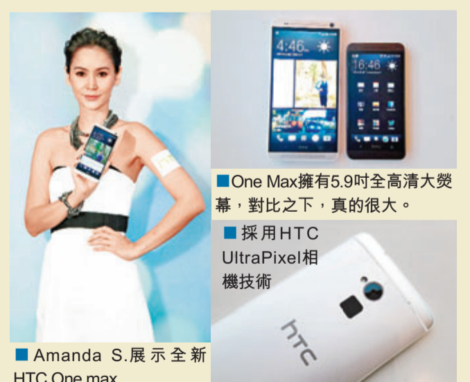
Amanda S.展示全新 HTC One max

這個月，筆者發現多了很多大屏幕的智能手機推出，上星期HTC亦宣佈推出One max，配備Full HD 1080p 5.9吋全高清大熒幕，為喜歡大尺寸智能手機的消費者而打造。它配備Qualcomm Snapdragon 600 1.7GHz四核心處理器，還內置16GB儲存空間，並支援最高達64GB microSD記憶卡擴充，更附送Google雲端硬碟(Google Drive)50GB特大雲端儲存空間。而且，內建的指紋辨識為手機操作的便利與功能性開創新紀元，其指紋辨識器設計於手機背面，使用者可輕鬆鎖屏或開啟熒幕，還能設定以不同手指解鎖手機鎖後快速開啟最愛的應用程式。售價：HK$6,198