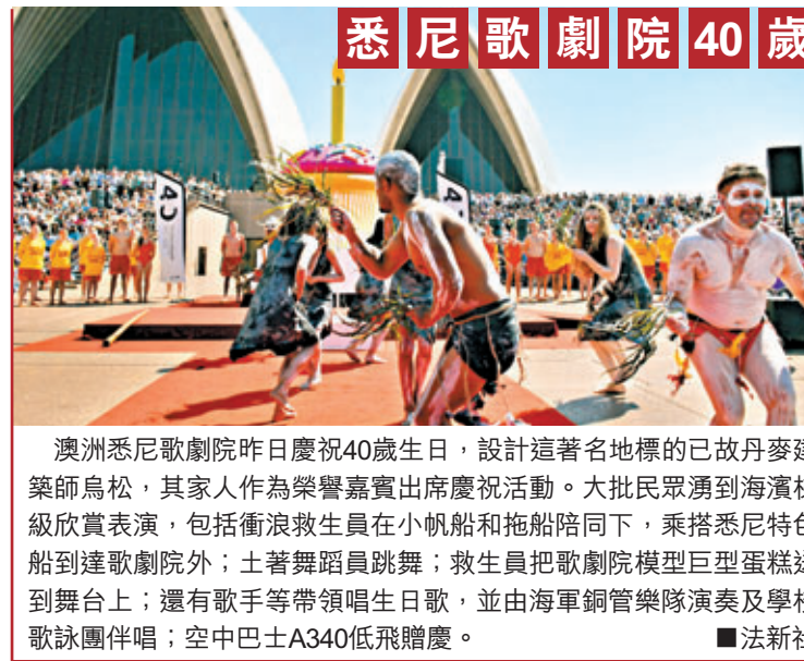
澳洲悉尼歌劇院昨日慶祝40歲生日，設計這著名地標的已故丹麥建築師烏松，其家人作為榮譽嘉賓出席慶祝活動。大批民眾湧到海濱梯級欣賞表演，包括衝浪救生員在小帆船和拖船陪同下，乘搭悉尼特色船到達歌劇院外；土著舞蹈員跳舞；救生員把歌劇院模型巨型蛋糕送到舞台上；還有歌手等帶領唱生日歌，並由海軍銅管樂隊演奏及學校歌詠團伴唱；空中巴士A340低飛贈慶。■法新社

情婦藏車尾箱偷入白宮「暢泳」 紐約一名社交名媛表示，肯尼迪出席其中一名前女友的派對時，直言不諱問：「你可否帶些年輕貌美女子給我？」甚至在妻子面前說：「我要這位。」肯尼迪曾在派對上與一名女子共舞5分鐘，然後消失20分鐘，積琪蓮毫不理會。 一名情婦憶述如何潛入白宮幽會。原來她先藏在車尾箱，進宮後被帶到泳池與肯尼迪「暢泳」。肯尼迪自稱若一日沒女伴，就會頭痛。 ■《星期日郵報》