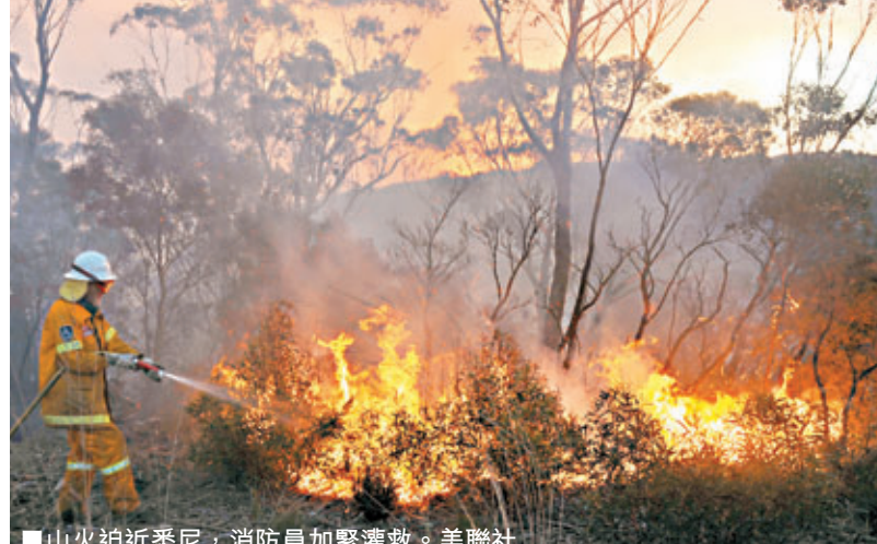
■山火迫近悉尼，消防員加緊撲救。