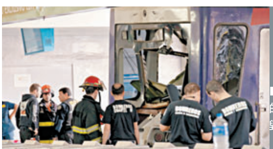
■撞上月台的火車，損毀嚴重。

阿根廷布宜諾斯艾利斯再發生火車撞月台意外，一列火車前日早上進站時，出軌衝上月台，造成99人傷，包括一名8歲小童，但所有人無生命危險。事發車站去年亦曾發生同類意外，當時造成52人死亡。事發時列車時速22公里，超過規定的12公里，有乘客指列車在兩個車站時，剎車器似乎已有問題。當局暫時排除事