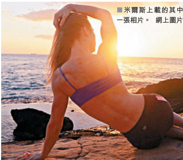
■米爾斯上載的其中一張相片。網上圖片