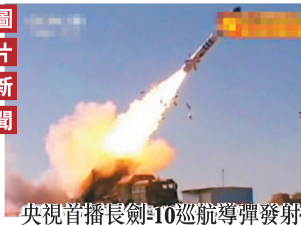
近日,解放軍頻頻展示實力,繼黃海軍演、三大艦隊赴西太平洋之後,央視七台首次播出陸基版長劍-10巡航導彈發射畫面。

會議強調,各地區各部門要對已出台的促改革、調結構措施落實情況開展自查,國務院將組織督查。力爭使政策措施取得更大成效,促進經濟社會發展繼續向好,為今後發展打下堅實基礎。