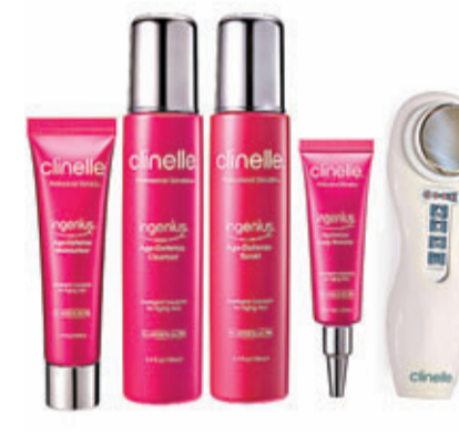
by Clinelle Ingenius智能細胞活肌限量組合

而by Clinelle Ingenius智能細胞活肌限量組合，更加配超聲波導入美容儀，透過超聲波導入技術，增加皮膚細胞間的隙縫，從而大大提升Ingenius獨有抗皺滋潤成分的穿透效能，從肌膚深處啟動細胞管理機制，加倍激發潛藏的青春天賦。15分鐘的導入護理，便能即時看到面上呈現緊緻及亮澤的效果；持續每星期一次的導入護理，你也可以擁有令人羨慕的年輕嫩滑肌膚。