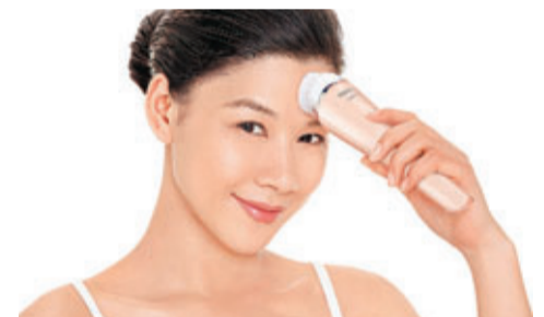
飛利浦VisaPure淨亮潔膚儀潔面刷頭，備有一般肌膚、敏感肌膚及去角質三款。

常言道：「潔膚是護膚最基本也是最重要的程序」，有見及此，飛利浦早前便推出了VisaPure淨亮潔膚儀，首創Dual Motion 2D淨亮科技，能深入毛孔清潔，讓你的嬌嫩肌膚徹底潔淨。只需潔面一分鐘，即可讓你感受潔淨、柔軟、亮滑的肌膚，於今天開始享受無垢肌膚，綻放美肌光采，達致「每天智然美」。其VisaPure的潔面刷頭能夠和諧地旋轉及輕柔震動，溫和潔面，並清除毛孔的污垢、死皮及殘餘的化妝品，較傳統用雙手卸妝帶來6倍以上潔膚功效。同時亦有助肌膚吸收潔面後使用的護膚品，為你帶來全方位的潔膚功效。加上，貼心的防水設計，更可讓你在淋浴中使用，同時為面部及頸部及的肌膚進行深層清潔，重拾白瓷嫩肌，於陽光明媚的盛夏中，展現傲人光澤。