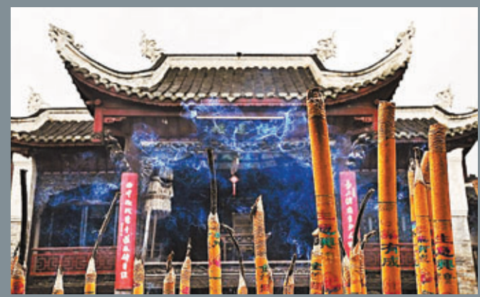
香火旺盛的佛教寺廟。