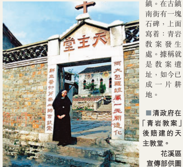
清政府在「青岩教案」後賠建的天主教堂。

事件中的基督教堂、天主教堂遺址如今也仍保留在古鎮。在古鎮南街有一塊石碑，上面寫著：青岩教案發生處。據稱就是教案遺址，如今已成一片耕地。