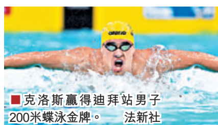
克洛斯贏得迪拜站男子200米蝶泳金牌。

2013年短池游泳世界盃迪拜站首日比賽前晚結束,南非名將克洛斯以百分之三秒之差與世界紀錄擦肩而過。21歲的克洛斯曾在去年的倫敦奧運會上在男子200米蝶泳決賽中擊敗偶像菲比斯,獲得金牌。在前晚的比賽中,克洛斯以1分49秒07輕鬆奪冠,但比他今年之前創造的世界紀錄慢了0.03秒。