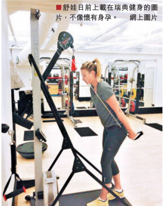
舒娃日前上載在瑞典健身的圖片,不像懷有身孕。

另外,來自法國的頭號種子宋加在維也納公開賽躋身8強。宋加今仗以7:5、1:6和6:3戰勝了德國球手白蘭斯。宋加賽後說:「我對自己說,現在我要集中自己所有能量,因為第2盤一開始他就破發。我要把專注力保持到最後一刻。」其餘躋身8強的還有德國老將夏斯等。