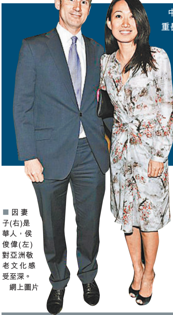
因妻子(右)是華人，侯俊偉(左)對亞洲敬老文化感受至深。

中國人重視家庭觀念，尊重長輩、孝順父母，英國衛生大臣侯俊偉昨日表示，英國有數以百萬長者慘被遺忘、孤獨終老，堪稱「國恥」。他呼籲英國家庭學習中國人的敬老精神，盡照顧長者的責任，不要輕言把長者送入老人院。