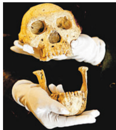
「頭骨5號」呈長面形。

科學家一直認為遠古人類存在不少分支(人種)，但這個概念可能被格魯吉亞發現的5個頭骨化石所推翻。昨在《科學》期刊發表的研究指，5個頭骨的特徵雖有異，但考慮到生存年期和地點，應屬同一人種，意味以往科學家按化石特徵差異劃分的不同人種，可能都是一家人，甚至改寫人類從非洲進化的歷史。