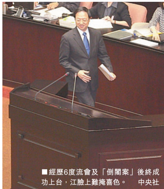
經歷6度流會及「倒閣案」後終成功上台，江臉上難掩喜色。