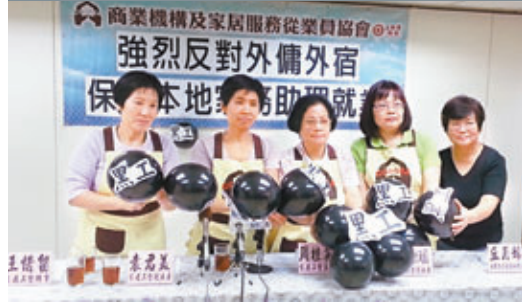
工聯會轄下家居服務從業員協會擔心，外傭外宿衍生「黑工」問題。

香港文匯報訊(記者 吳芷芊)僱員再培訓局每年培訓大批本地家務助理，為香港家庭提供家務服務。面對有團體爭取外傭外宿，工聯會轄下家居服務從業員協會擔心，此舉會損害本地家傭就業機會，並衍生「黑工」問題。協會強調，外傭外宿會破壞外傭和本地家傭兩個服務市場的界線，故會向政府部門反映，並爭取把本地家傭列入勞工法例保障範圍。