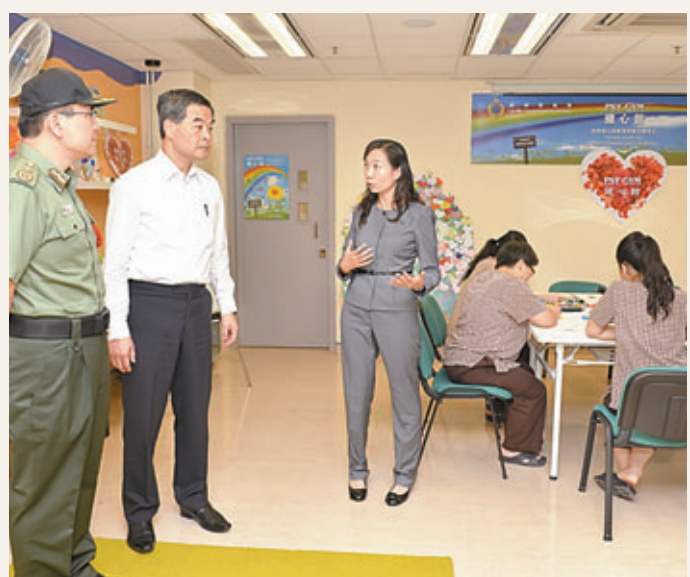
梁振英在單日堅陪同下，到訪羅湖懲教所，參觀名為「健心館」的心理輔導室，了解院所為女性在囚人士提供的心理輔導服務。

但對於市建局因重建工程而需要提前清拆，表示無奈。「大聯盟」又指，「鮮貨大樓」落成後只有兩層，合共10個舖位，每間舖面積為450呎，建議市建局可把舖位劃分為大、中、小，以增加檔數，令市民有更多選擇。「大聯盟」現已把資料交予各商戶，並將於數天內向商戶派發問卷收集意見。下周二開會後，「大聯盟」會再與市建局商討分區清拆方案，並表示會盡量配合當局建議。